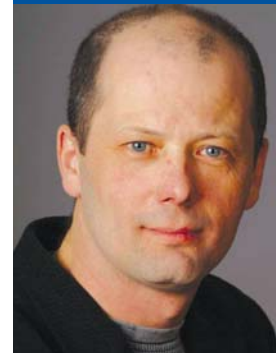
Président provincial Claude Arseneault

Mettons-y du jeune ! 15 ème congrès Saguenay du 8 juin au 12 juin 2009