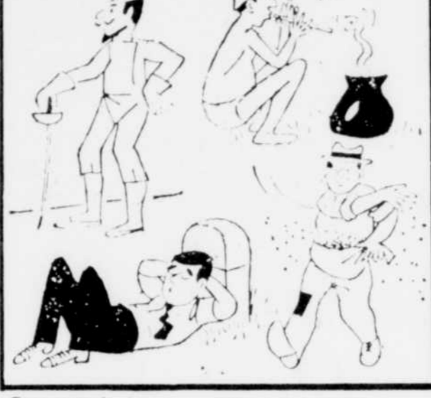
Ces quatre dessins ont un point commun. Lequel ?