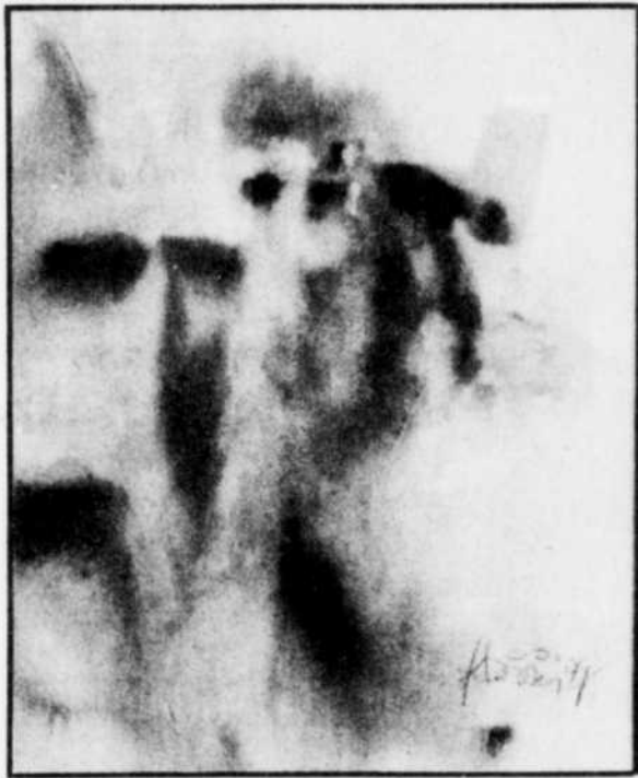
Une aquarelle de Francine Boivin

leur, sa fluidité, son mouvement, mais aussi par représentation de personnages souvent tourmentés.