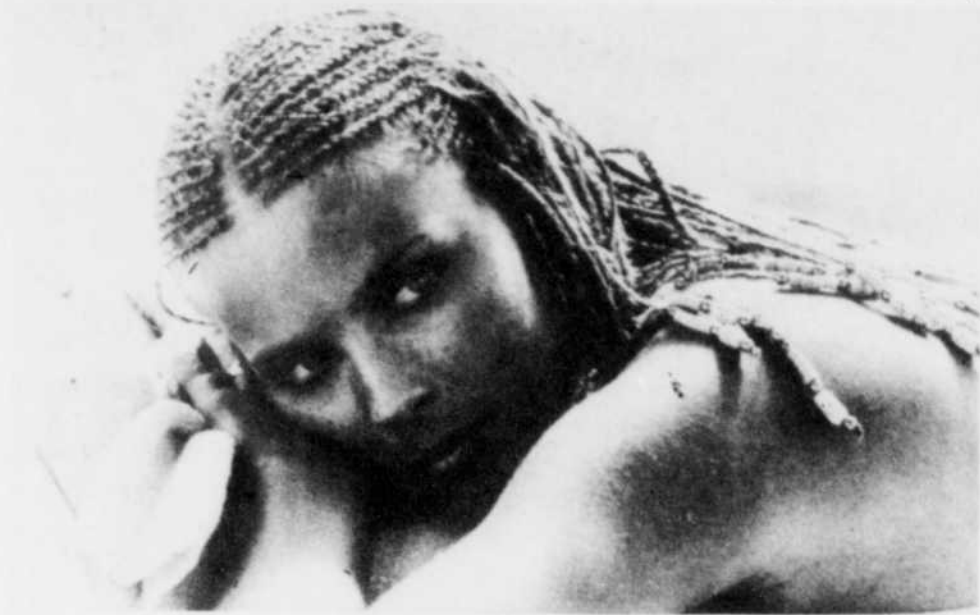
Bo Derek dans "Ten"

Inutile de dire que, ce mois-là, les ventes du célèbre magazine américain sont montées en flèche.