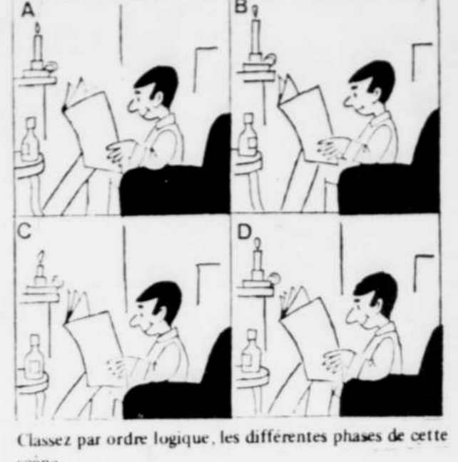
Classez par ordre logique, les différentes phases de cette scène.