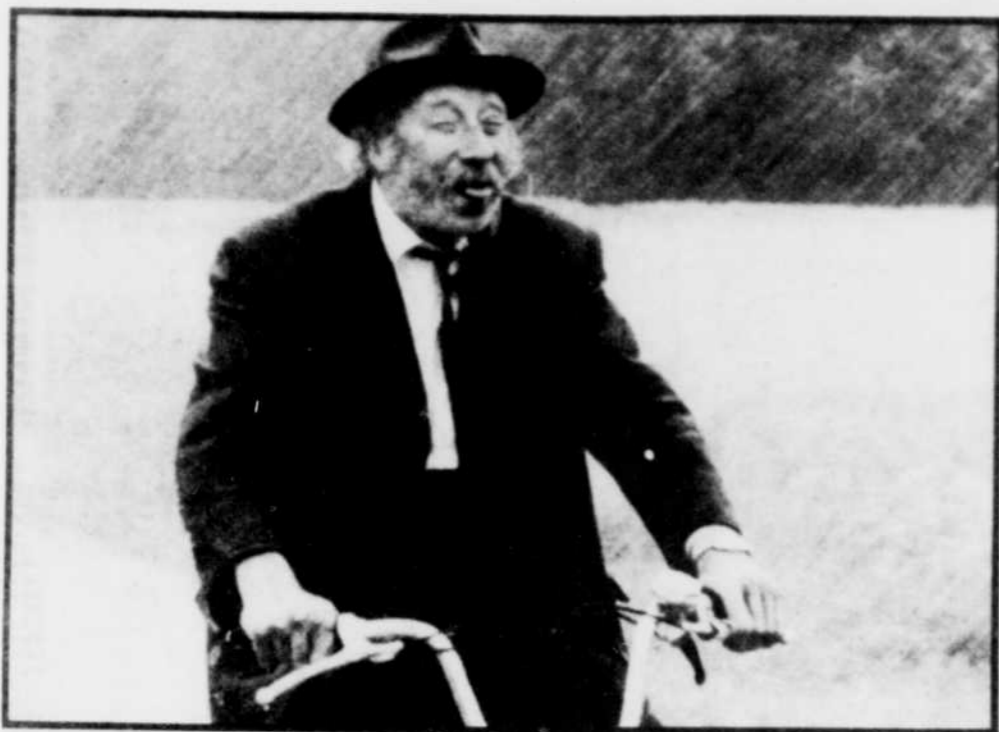
Une scène du film "Les petites fugues" de Yves Yersin.

On offrira encore deux représentations le samedi soir, la première à 19 heures et l'autre à 21h 30.