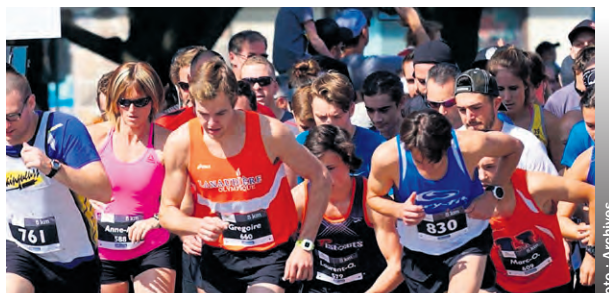
Des coureurs d'une édition précédente de la Galopade, en pleine action.

Sur les divers parcours, qui se dérouleront dans Saint-Esprit, des points de ravitaillement avec eau et station sanitaire seront aménagés. De plus, des bornes de kilométrage seront installées pour permettre aux participants de se situer tout au long du parcours. Une boîte à lunch attendra également chaque coureur au kiosque de goûter, après leur épreuve.