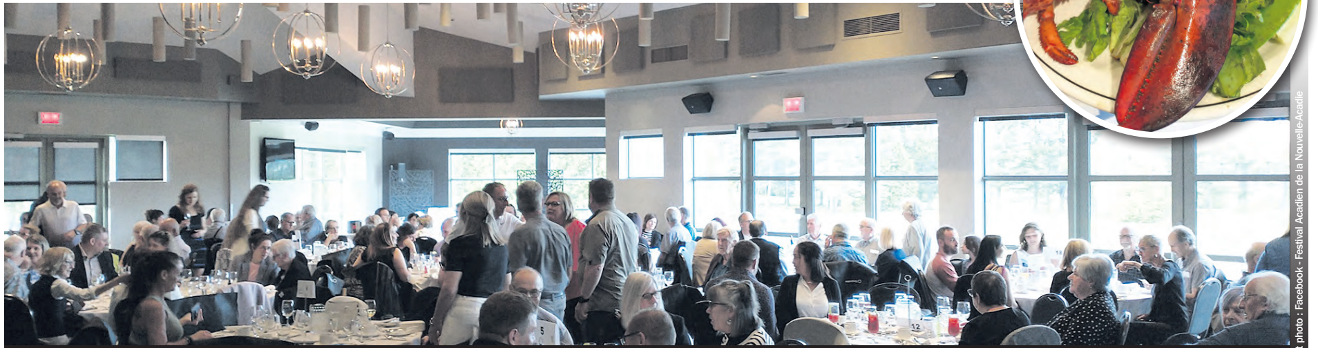
Les convives lors du souper-bénéfice du 26 mai, au Club de golf Montcalm.