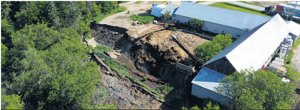
Vue aérienne du mouvement de sol aux abords de la rivière Rouge.