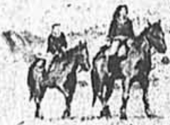
automne lac et la

À nouveau cette année, le Manoir vous offre son forfait haut en couleurs. Entre le lac et la montagne, à quelques