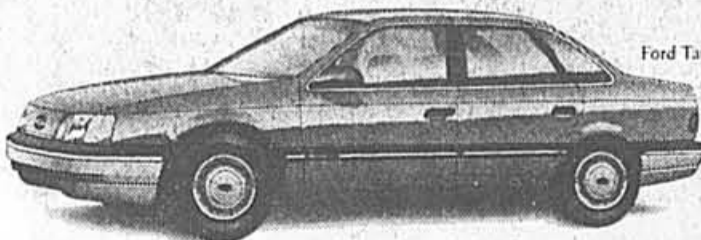
Ford Taurus GL