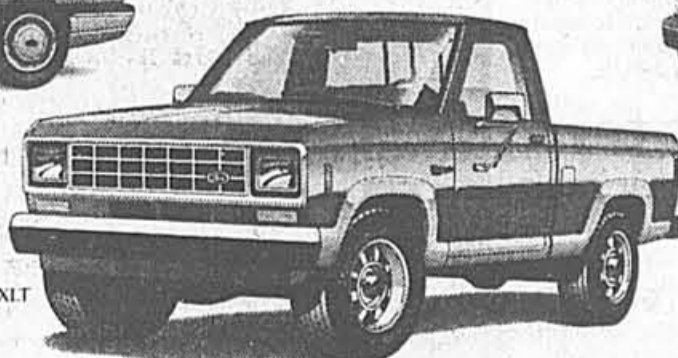
Ford Ranger XLT