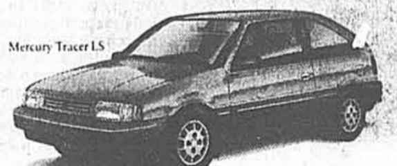
Mercury Tracer LS