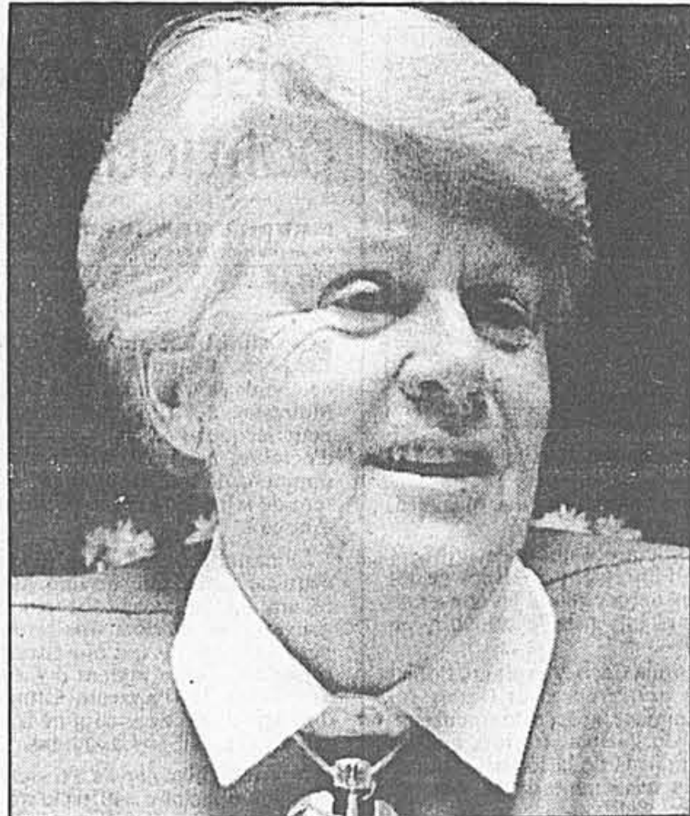
Mme May Cutler, mairesse de Westmount.

La Presse accorde priorité sous cette rubrique aux lettres qui font suite à des articles publiés dans ses pages et se réservent le droit de les abréger. L'auteur doit être clair et concis, signer son texte, donner son nom complet, son adresse et son numéro de téléphone. Adresser toute correspondance comme suit: Tribune libre, La Presse, 7, rue Saint-Jacques, Montréal, H2Y 1K9.