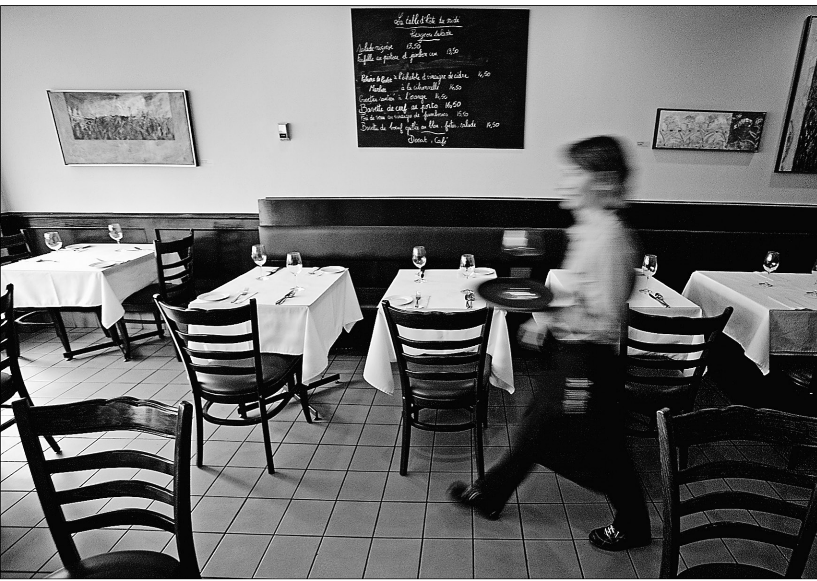
Le restaurant le Margaux présente de la cuisine classique pure mais qui innove par petites touches parfaitement maîtrisées.