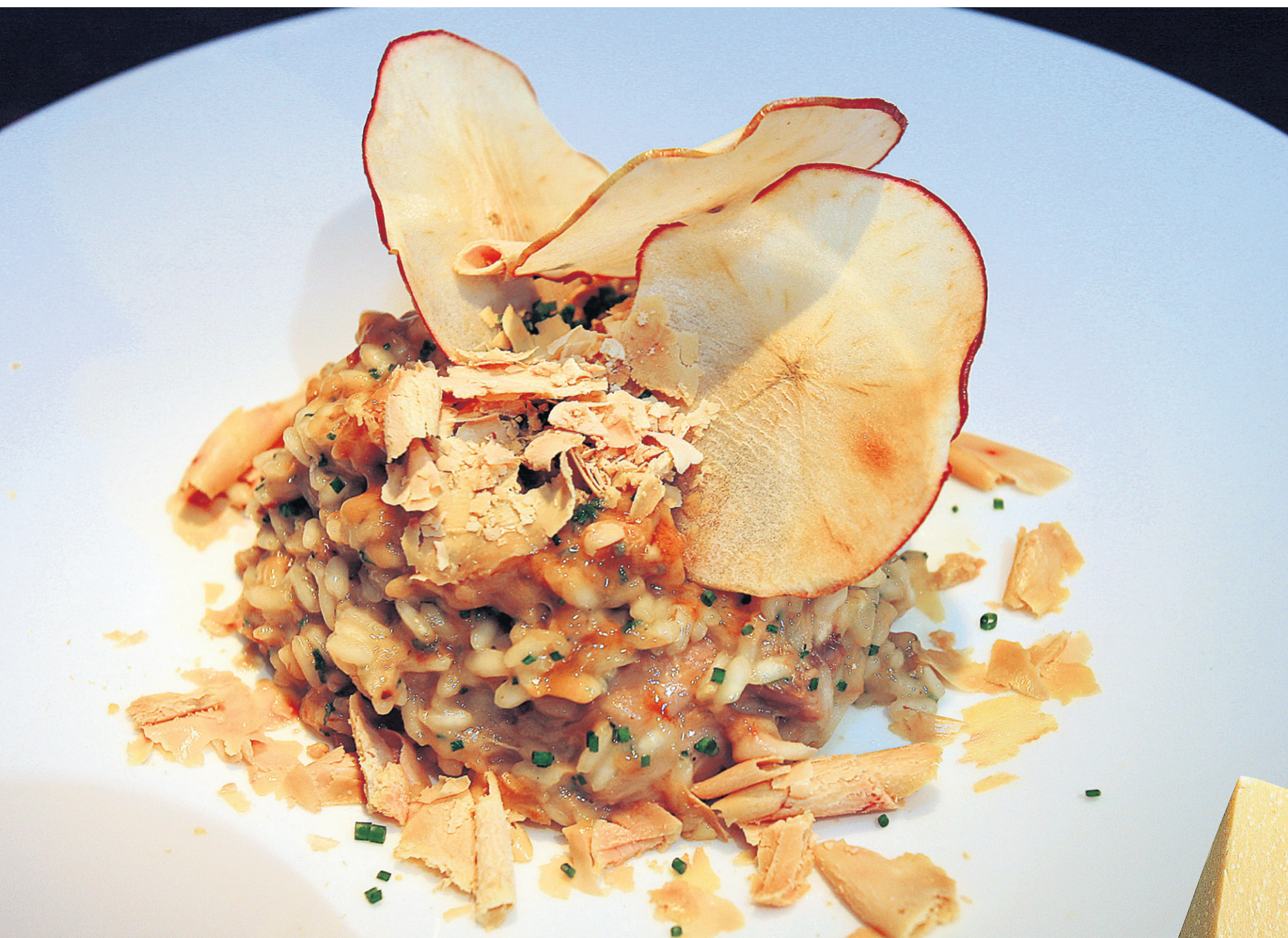
Risotto au porclet, copeaux de foie gras et croustilles de pommes.