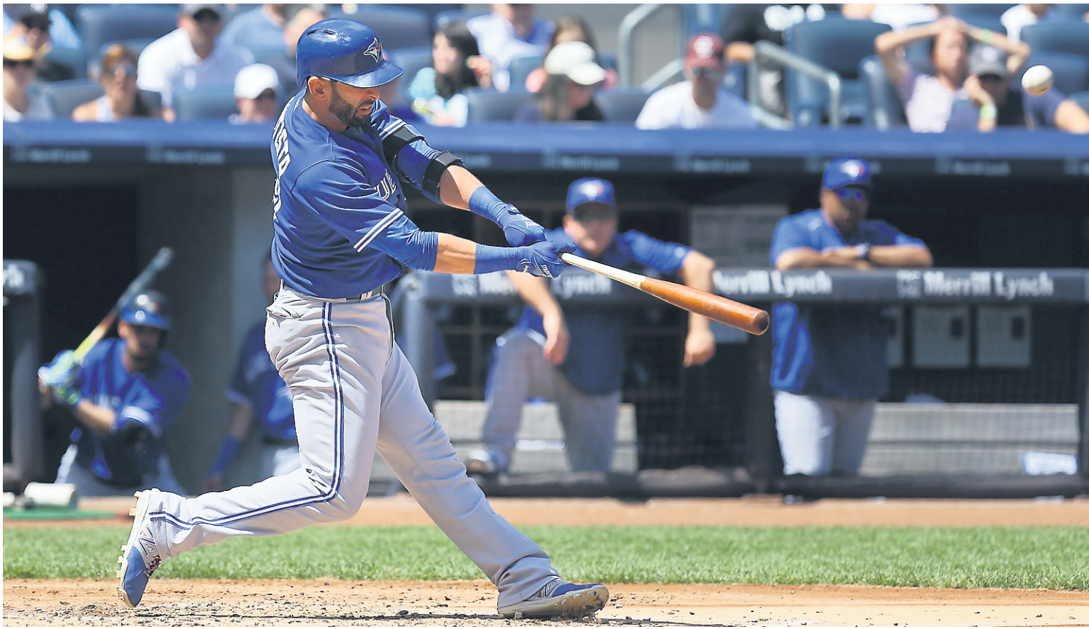
Jose Bautista a frappé un circuit hier pour Toronto, qui a remporté 11 de ses 12 derniers matchs.