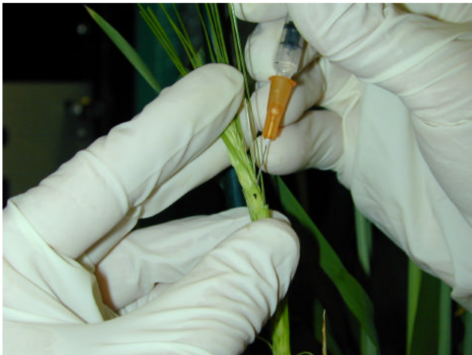
Travaux de phytopathologie : inoculation de Fusarium par injection dans un épi de blé.

Ce sont 17 des 27 projets conduits en 2006 qui comportaient une contribution financière externe pour une valeur totale de près de 80 000 $. Les fiches de projet de la partie 4 du présent document font état des aides financières obtenues pour chacun.