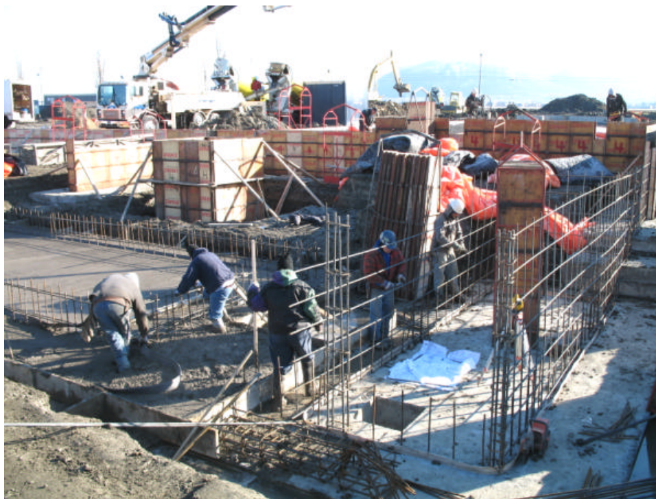
Fondations du bâtiment du CÉROM : coffrage, armature et coulée de béton réalisés sous des conditions météo exceptionnellement clémentes, le 12 décembre 2006.

L'appel d'offres pour la construction du bâtiment a été lancé le 13 juin et l'ouverture des soumissions s'est tenue le 13 juillet 2006. Puisque le prix du plus bas soumissionnaire dépassait le budget prévu, un travail intense de plusieurs semaines a été réalisé par les professionnels, les responsables du projet au CÉROM et le plus bas soumissionnaire afin de ramener le coût de réalisation à un niveau acceptable.