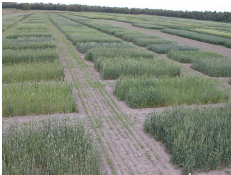
La recherche en grandes cultures requiert la réalisation de milliers de parcelles.

La partie 4 de ce rapport présente une brève synthèse des projets qui étaient en cours en 2006 et qui se poursuivent, des réalisations pour chacun et des avenues envisagées pour 2007.