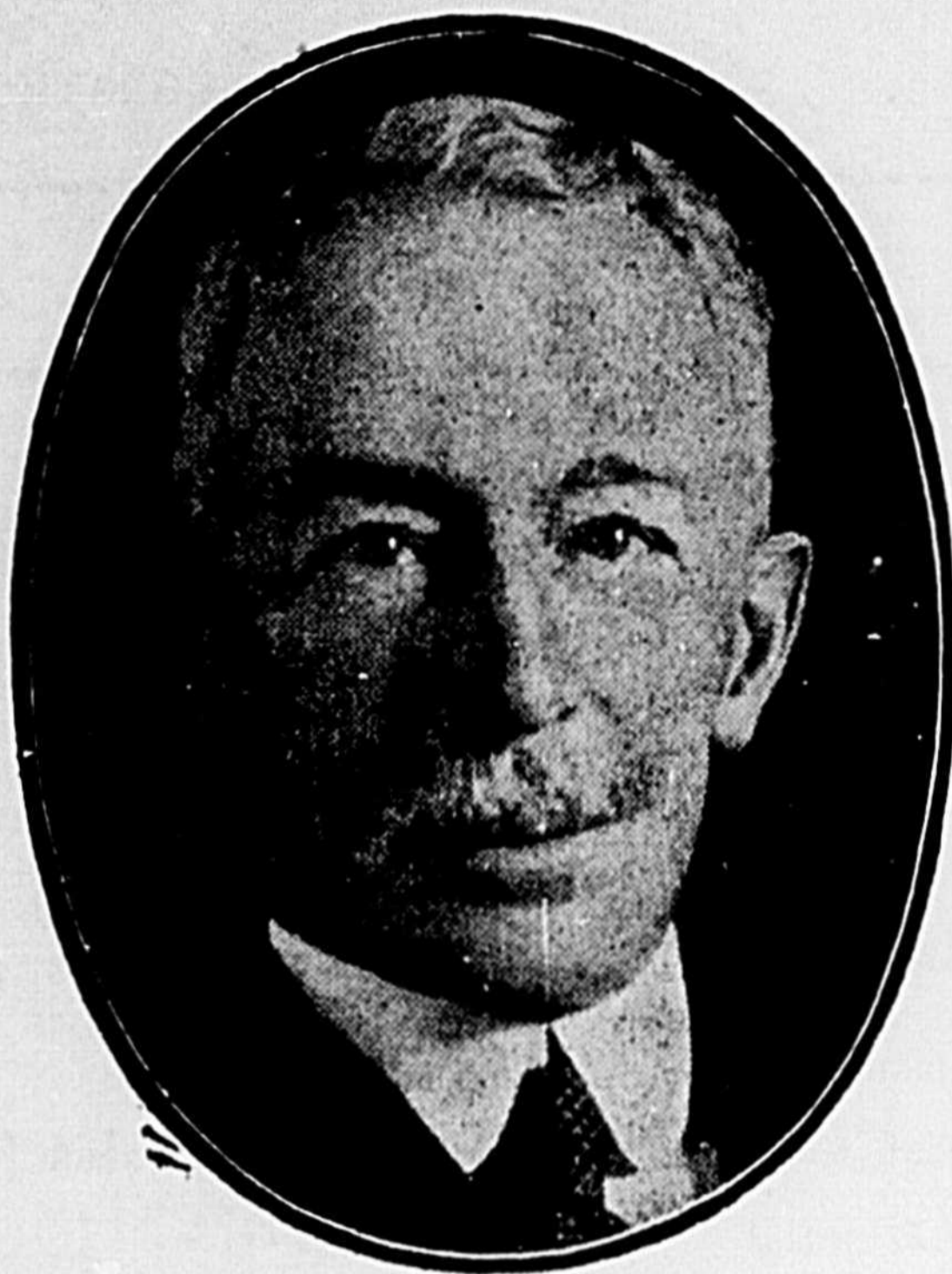
L'honorable M. ALEXANDRE TASCHEREAU