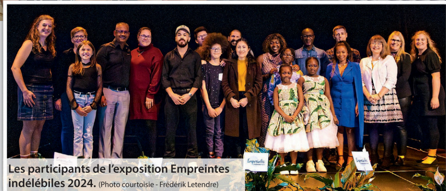
Les participants de l'exposition Empreintes indélébiles 2024.

Pour ce faire, c'est en général entre 9 et 10 personnes qui sont sélectionnées à chaque édition d' Empreintes indélébiles . Les critères de sélection des participants sont principalement basés sur leur implication dans la communauté, leur diversité d'origine et d'emploi, ainsi que leur capacité à laisser une empreinte positive sur la ville.