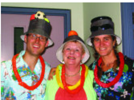
L'équipe du centre d'éducation à la santé lors de la fête au CLSC d'Ahuntsic

Voici quelques photographies des fêtes qui ont eu lieu les 7 et 13 septembre aux CLSC d'Ahuntsic et de Montréal-Nord.