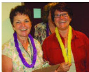
Deux participantes au quiz santé au CLSC de Montréal-Nord