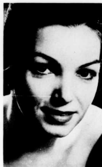
Monique Leyrac Canada « Les Amours anciennes »