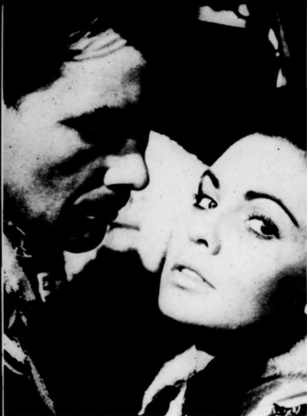
« Fille des steppes »