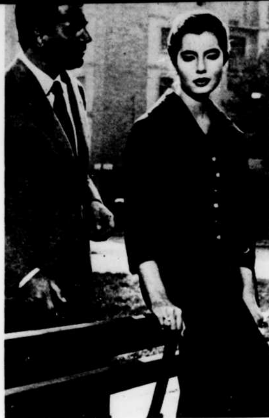
« Les Époux terribles »