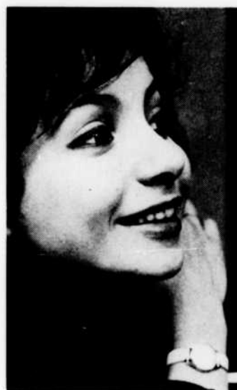
Ester Ofarim Suisse « Saint-Amour »