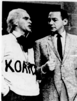
Wayne et Shuster

8.00—The Ed Sullivan Show Directement de Toronto, avec Johnny Wayne et Frank Shuster, Xavier Cougat, Abbe Lane, Jack Carter, Connie Francis et Jan Peerce.