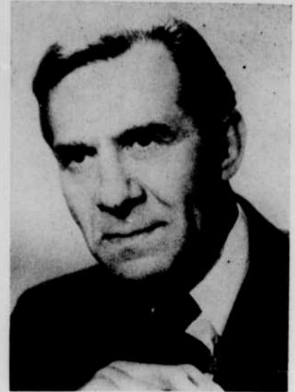
JEAN YONNEL Don Diègue