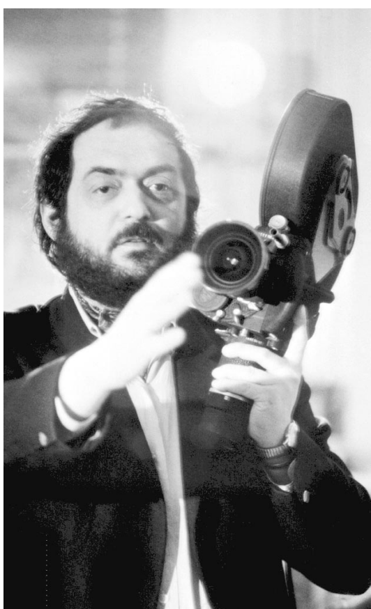
Le réalisateur Stanley Kubrick.