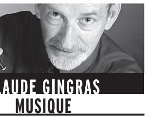
CLAUDE GINGRAS MUSIQUE

Notre liste traditionnelle des morts de l'année en musique révèle que Montréal fut particulièrement éprouvée en l'an 2000. Trois noms viennent immédiatement à l'esprit : le baryton Louis Quilico, qui chanta Rigoletto plus de 500 fois à travers le monde, le compositeur Jean Papineau-Couture, également réputé comme pédagogue, et l'historien Gilles Potvin, qui fut l'initiateur de l'Encyclopédie de la musique au Canada.