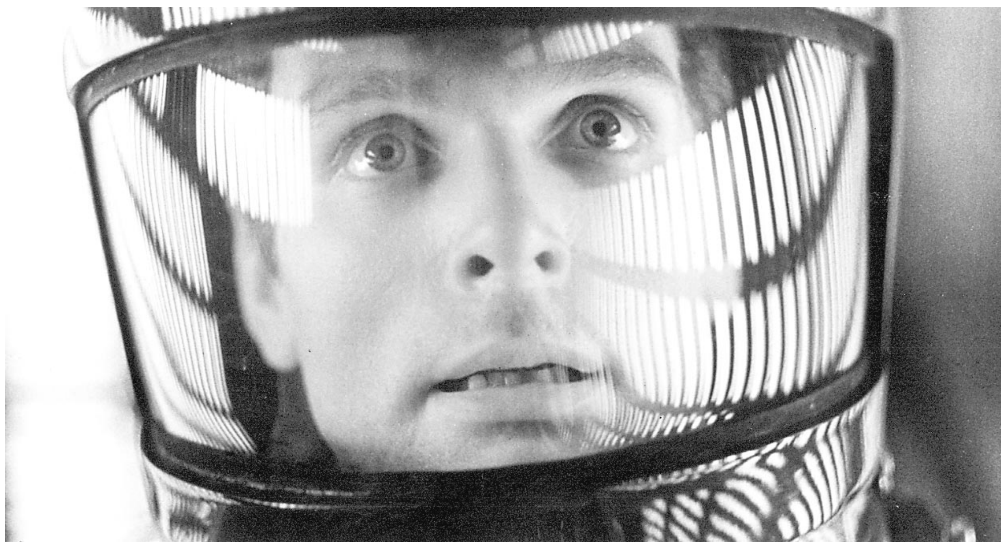
Le commandant David Bowman (Keir Dullea) en mission.