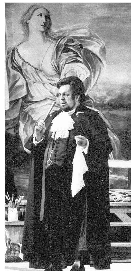
PHOTO THÉÂTRE La Presse © Louis Quilico dans le rôle du baron Scarpia, dans l'opéra Tosca, de Puccini, présenté par l'Opéra de Montréal en 1987.

Beaucoup de disparus également dans le monde du chant, les plus connus étant la soprano Suzanne Danco, les barytons Walter Berry et Bernard Kraysen, les té-