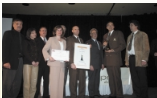
CATÉGORIE RÔLE CONSEIL Sûreté du Québec