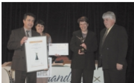
CATÉGORIE MANDAT DE VÉRIFICATION Commission de la construction du Québec