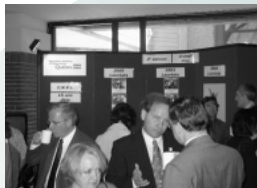
Une petite pause...