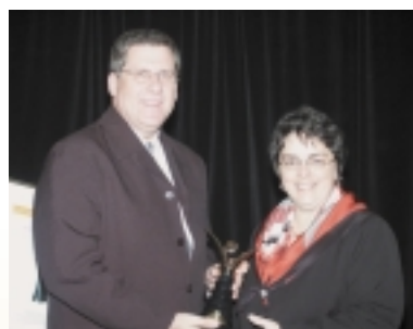
CATÉGORIE RAYONNEMENT DE LA PROFESSION Groupe interministériel