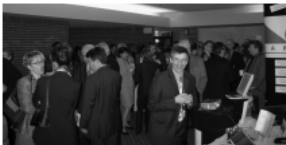
Rien de tel qu'un arrêt pour discuter entre participants.