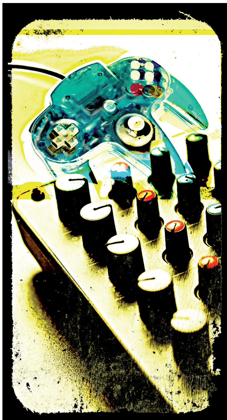
ILLUSTRATION DANIEL RIOPEL, LA PRESSE

« Le jeu n'a pas fini de se développer, poursuit M me Gagnon. Il suffit de prendre les transports en commun pour constater que de plus en plus de gens de tous âges jouent. Il y a maintenant plus de jeux pour différents segments de clientèle, et pas seulement pour les gros joueurs sur les consoles classiques. L'un des domaines d'emploi qui a le plus d'avenir est la programmation. En effet, sur les plateformes mobiles, la programmation est encore plus importante que dans les jeux de console, tandis que ces derniers, à cause des rendus graphiques d'excellente qualité, nécessitent des personnes à la créativité aiguisée. »