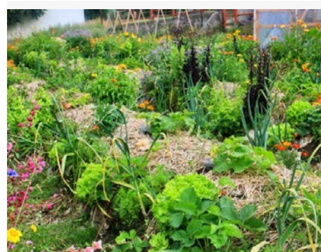
Potager permaculture

La biodiversité au potager! – Le jardinier peut, assez facilement, aménager son po-