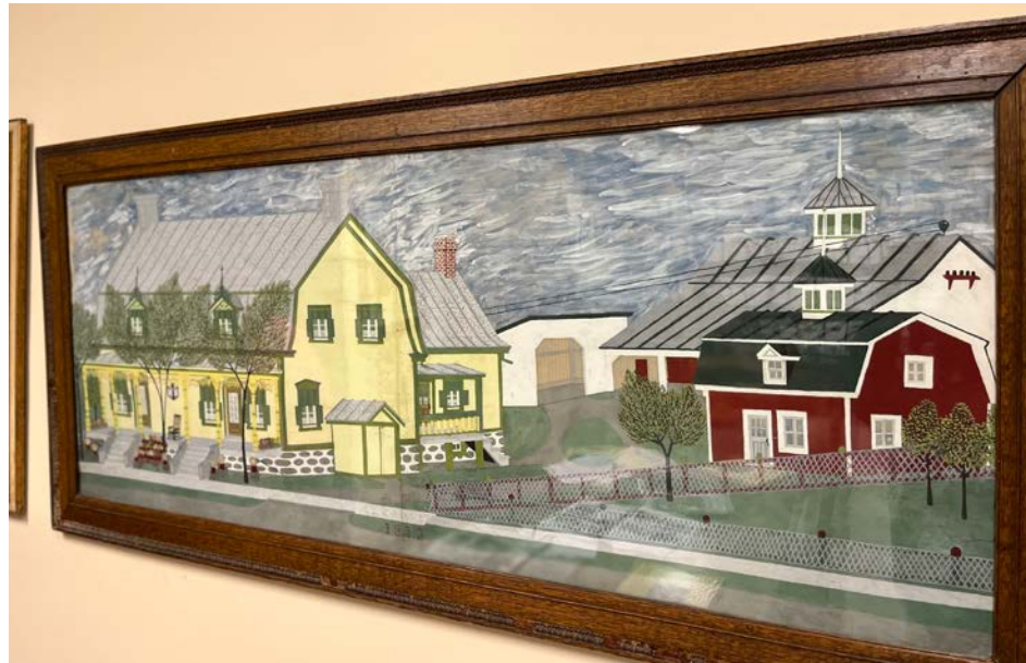
Cette maison et tous ces bâtiments occupent le site actuel du Manoir Saint-Bruno.