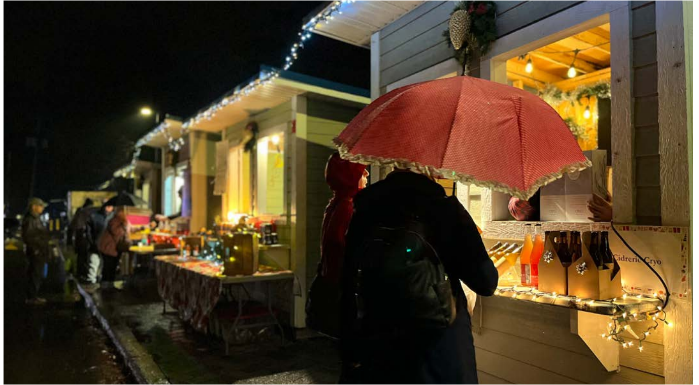
Un vendredi soir sous la pluie pour les visiteurs de la Féerie au lac du Village.

Le Journal de Saint-Bruno était sur place vendredi et dimanche. En voici un bref aperçu en images.