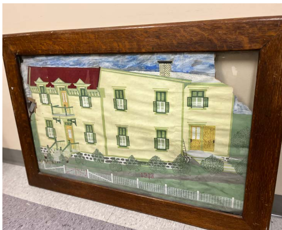
La maison jaune qui était autrefois sur Grand Boulevard Ouest.