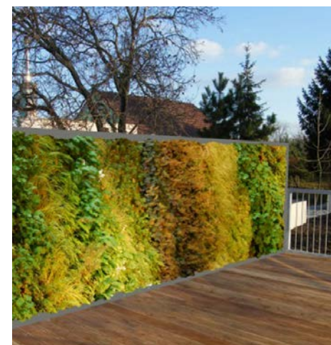
Mur végétalisé.

b) Offrez des abris et des lieux de reproduction pour les insectes et les petits animaux en plantant une diversité de végétaux;