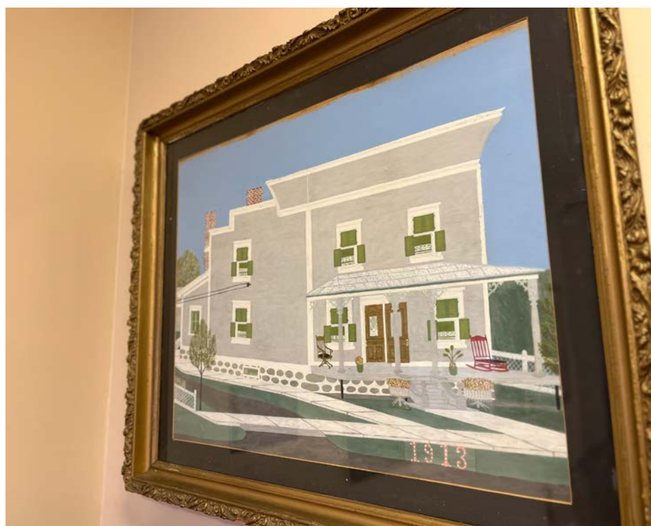
Qui a peint cette maison grise, dont le site est aujourd'hui occupé par COTE 100?