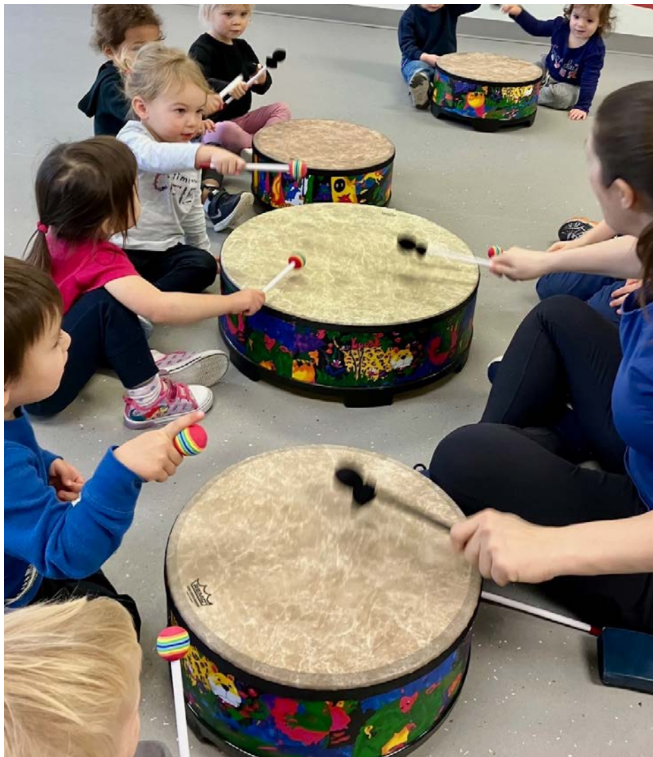
Depuis cette année, le C.A.M.E offre une activité d'éveil musical.

Le centre d'animation mère-enfant (C.A.M.E) de Saint-Bruno fêtera bientôt ses 40 ans d'existence.