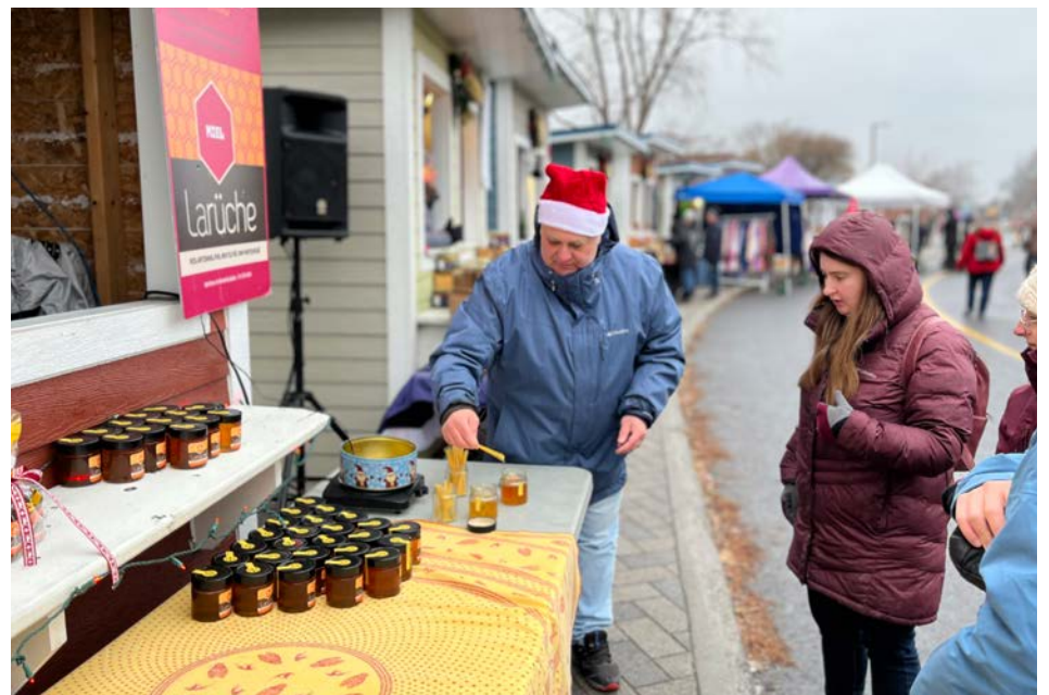
La Féerie lac du Village se déroulait sur quatre jours.