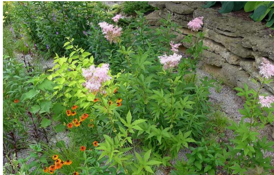
Jardin de pluie

Agriculture urbaine – C'est le résultat d'un mouvement citoyen visant à réduire l'empreinte écologique en consommant des aliments produits localement par une agriculture de proximité. Ce type d'agriculture populaire peut être privé, communautaire ou commercial.