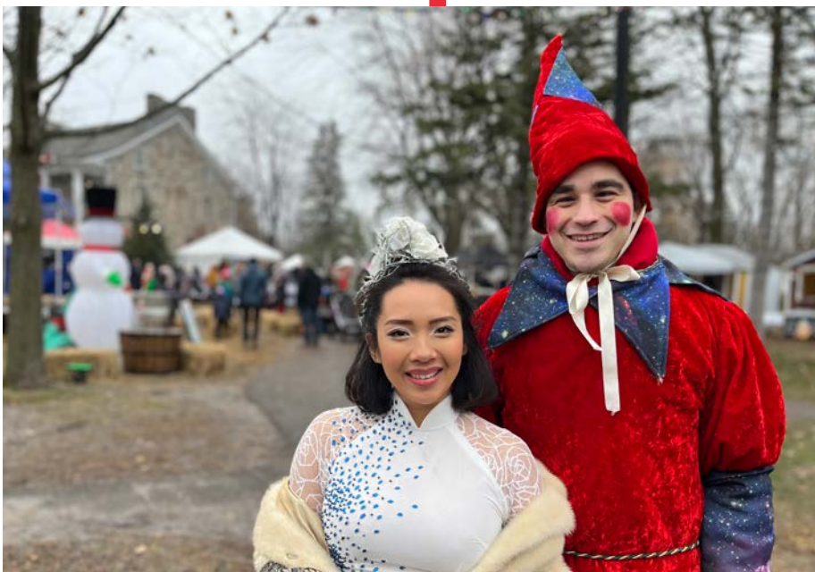
Animation et activités étaient proposées pour petits et grands.