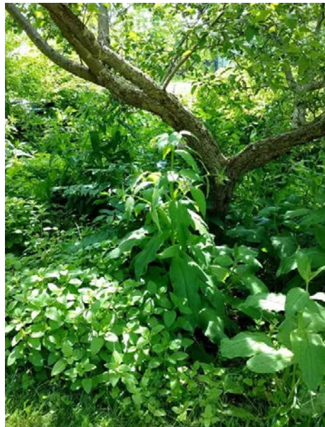
Forêt nourricière

Réal Scalabrini membre de la Société d'horticulture et d'écologie de Saint-Bruno WWW.SHESB.ca