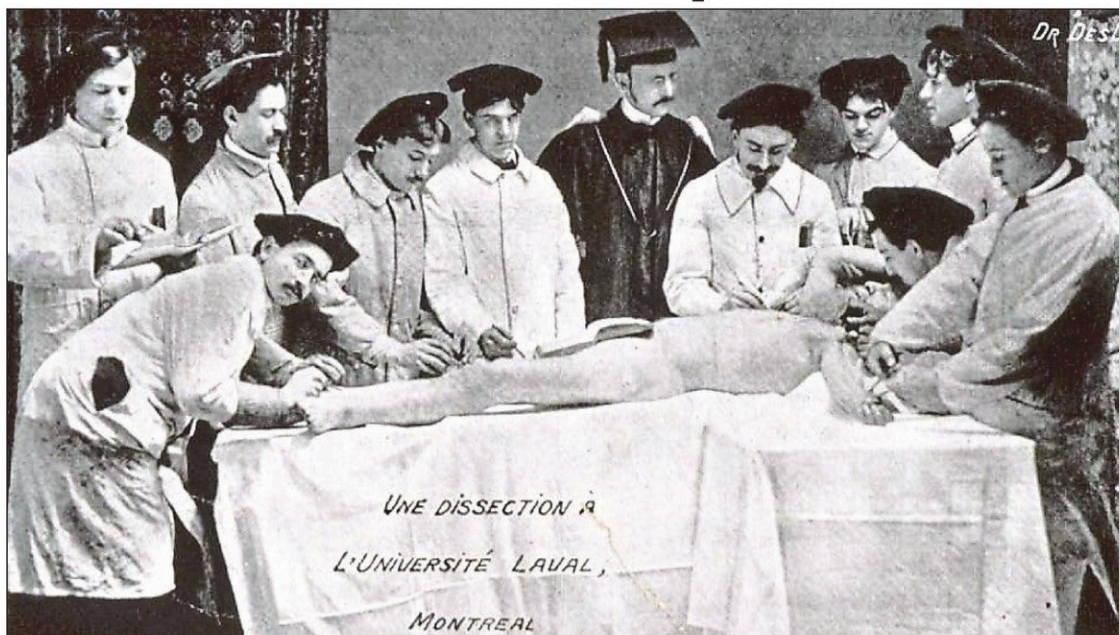
Une photo qui en dit long sur ce qui se passait à une autre époque.

Les carabins (étudiants en médecine) considèrent les morts comme du matériel scientifique qui leur permet de parfaire leur compréhension du corps