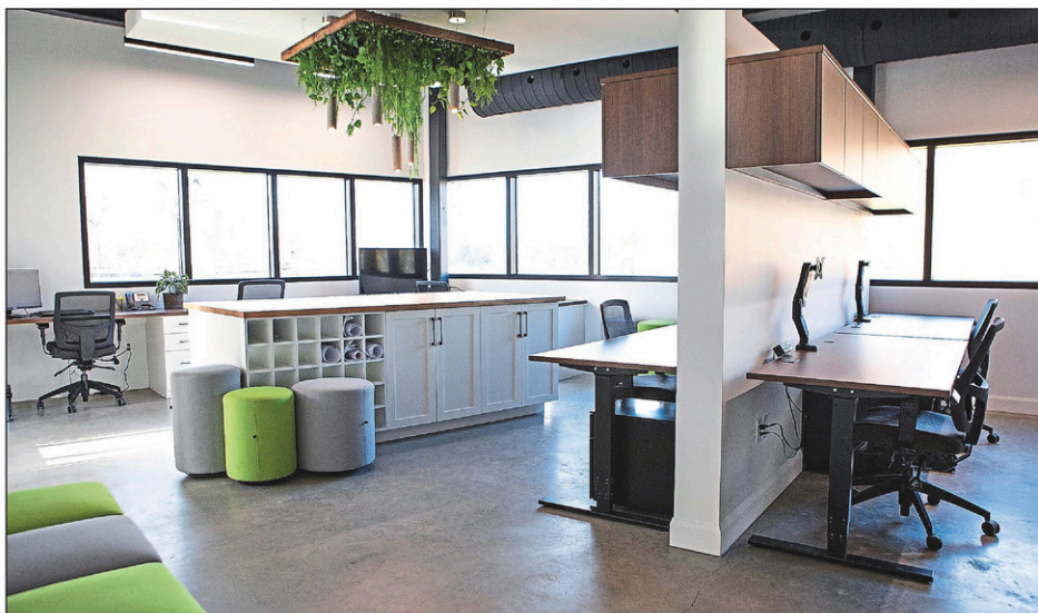
L'immeuble, qui comporte de grandes aires ouvertes, prévoit onze espaces de travail collaboratif.

Le projet qui rend le trio le plus fier est l'agrandissement et la modernisation de l'unité des soins intensifs du Centre hospitalier de Granby. En pleine pandémie de COVID-19, une unité de 20 000 pieds carrés a été construite au-dessus de l'urgence. Cette dernière est demeurée fonctionnelle durant toute la durée du projet.