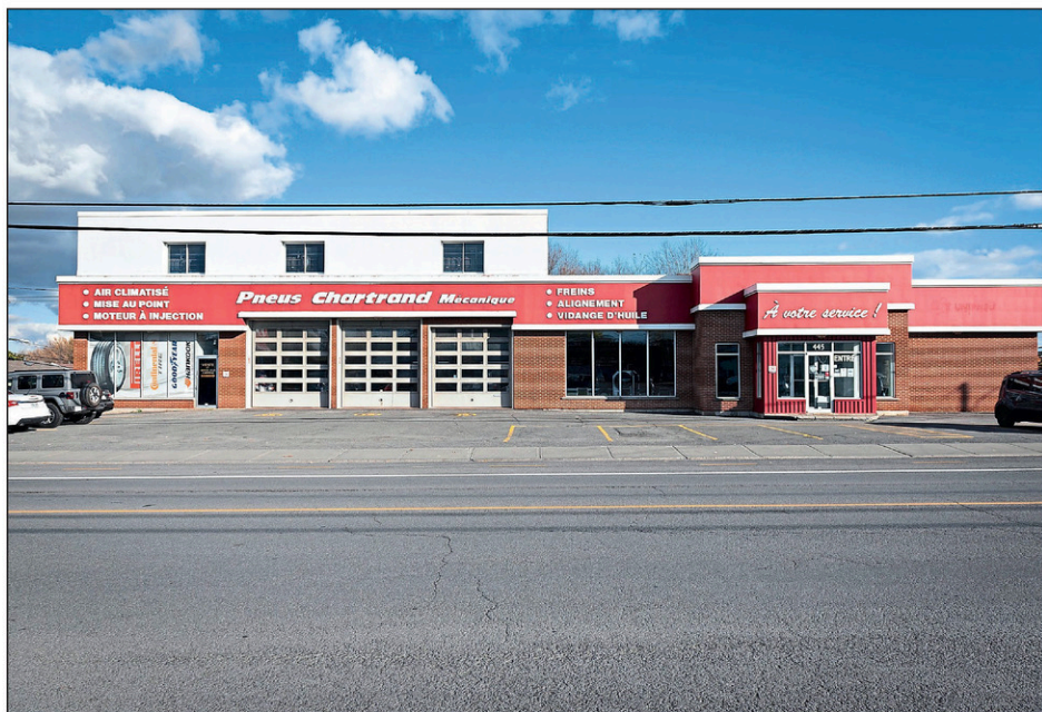
Plus tôt cette année, le Groupe Touchette a acquis Pneus Chartrand, qui compte notamment une succursale sur la rue Jacques-Cartier Sud à Saint-Jean-sur-Richelieu.