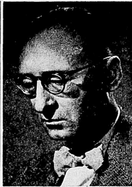
Notre Simenon canadien

Mais le défaut capital du livre, à notre sens, c'est le nombre incalculable de personnages. On se croirait en présence d'un bottin téléphonique ou d'un générique de film français. L'auteur aurait dû en sacrifier les 2/3 cela aurait