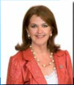
MOT DE LA PRÉFET DE LA MRC DE MARGUERITE-D'YOUVILLE