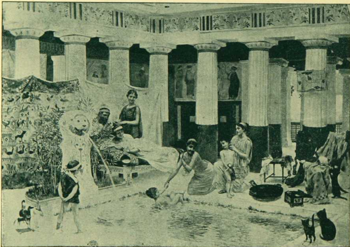
“ LE GYNECEE, ” par G. ROCHEGROSSE.

CE TABLEAU qui a été exposé au Salon des Champs Elysées, à Paris, fait partie des collections de LA SOCIÉTÉ DES ARTS DU CANADA . . . . .