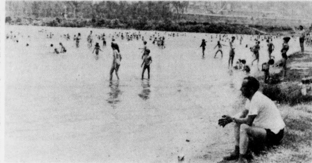
Quand il fait chaud, chaud, chaud... quoi de plus attirant que l'eau d'une rivière ou d'un lac.