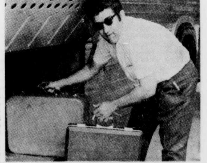
Un employé de la gare d'autobus à Sherbrooke chargeant les valises d'un voyageur en partance de Sherbrooke.

SHERBROOKE, (RB) — "Notre objectif doit être de fournir à chacun des citoyens du Québec la possibilité de s'épanouir. Pour ce faire, il ne faudrait pas que nous nous limitions à une conception trop étroite de l'action culturelle. Celle-ci ne se ramène pas à rendre accessible à un nombre toujours plus grand les biens culturels traditionnels, trop longtemps l'apanage d'une élite. Elle doit également créer les conditions les meilleures pour l'expression d'une identité et pour la créativité. En un mot, la culture doit être un langage pour une collectivité." C'est en ces termes que le ministre des Affaires culturelles du Québec, M. François Cloutier, a terminé l'exposé qu'il a fait des politiques de son ministère, alors qu'il parlait hier midi au banquet de clôture du colloque culturel inter-provincial, dont les assises avaient lieu à l'Université de Sherbrooke. Tout au long de son exposé, M. Cloutier s'est employé