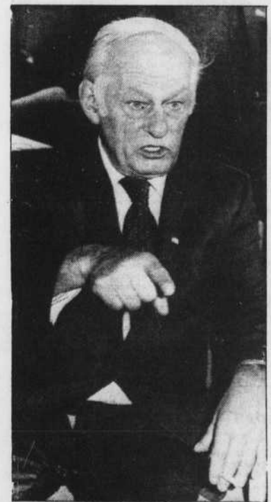
M. René Lévesque à Saint-Jean.