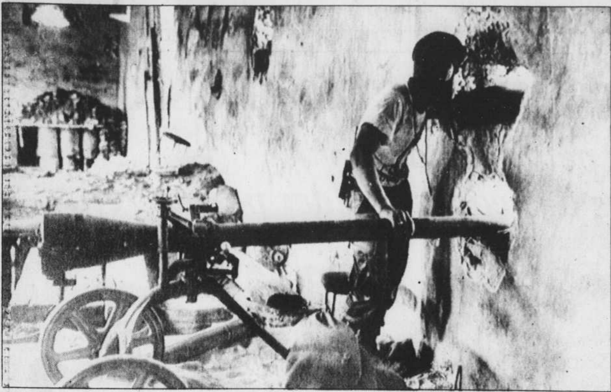
Un militant musulman jette un regard vers le quartier chrétien de Beyrouth-Est pendant un échange de duels d'artillerie hier. Les combats entre milices chrétiennes et musulmanes se poursuivent dans la ville depuis lundi.