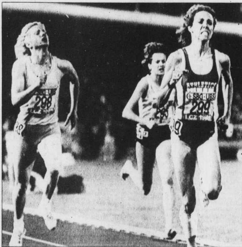
Mary Decker-Slaney fournit un dernier effort pour devancer au fil la Roumaine Maricica Puica (no 298) et la Britannique Zola Budd, et ainsi réaliser la meilleure performance mondiale au mille en quatre minutes, 16,71 secondes, hier à Zurich.

Cette idée nouvelle il n'y a que le Québec qui pourrait la véhiculer et s'en faire le porte-parole. Le Québec qui est si différent dans tout ce beau monde fallacieusement francophone. Ces jeux réunissant des causeurs de langue française, langue seconde pour la plupart, ont maintenant comme leaders des Québécois, qui n'ont pas encore de pays à eux, et qui tiennent un langage tout fait d'animation et de presque altruisme. Le Québec s'est fait reconnaître à ces jeux. Un peu trop, peut-être, si on s'en tient aux objectifs de la Fraternité de politique. Mais pas encore assez quand on connaît la richesse intellectuelle de ceux qui pilotent le dossier.