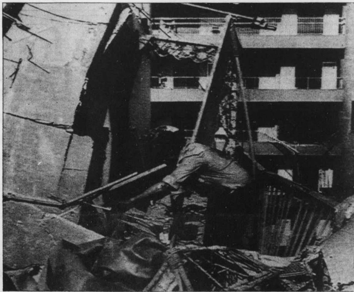
Les lourds tirs d'artillerie des derniers jours ont détruit plusieurs immeubles dans le quartier musulman de Beyrouth. Il ne reste plus aux habitants délogés qu'à retrouver leurs possessions dans les décombres.