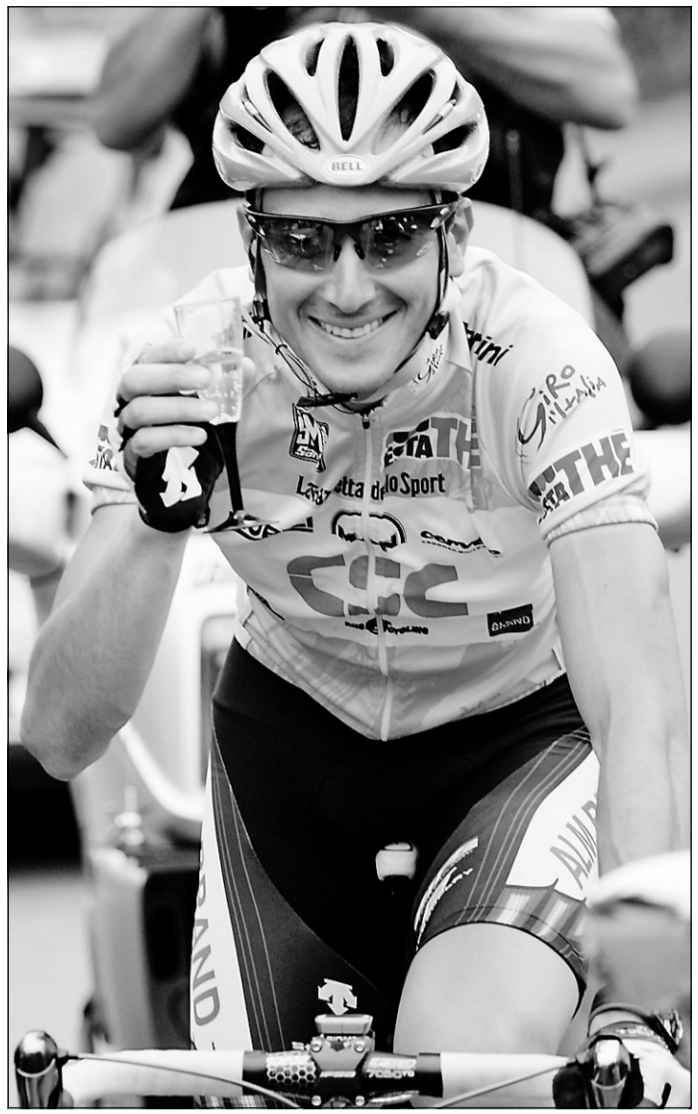
Le champagne de la victoire pour Ivan Basso.