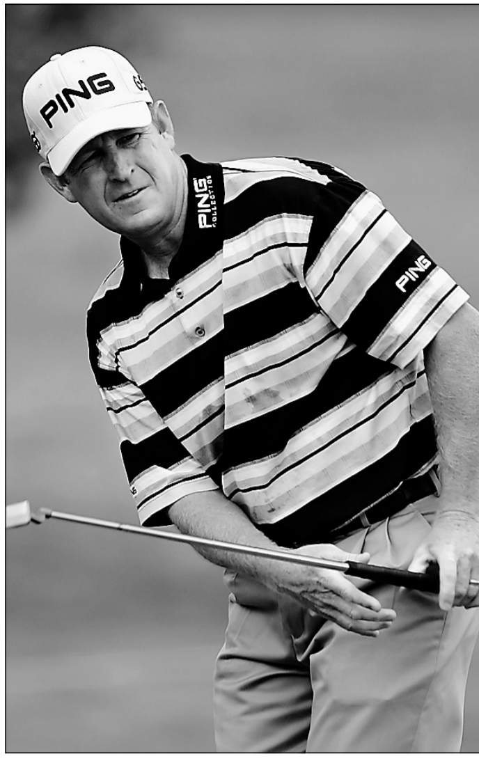
Jeff Maggert, 42 ans, a signé, hier, sa première victoire depuis 1999 en remportant la Classique St. Jude.

MAGGERT REMPORTE LA CLASSIQUE ST. JUDE > Jeff Maggert a remporté la Classique St. Jude, hier, et signé sa troisième victoire dans la PGA, sa première depuis 1999. Il a ramené une carte de 65, cinq sous la normale, lors du dernier parcours pour s'imposer par trois coups devant Tom Pernice fils.