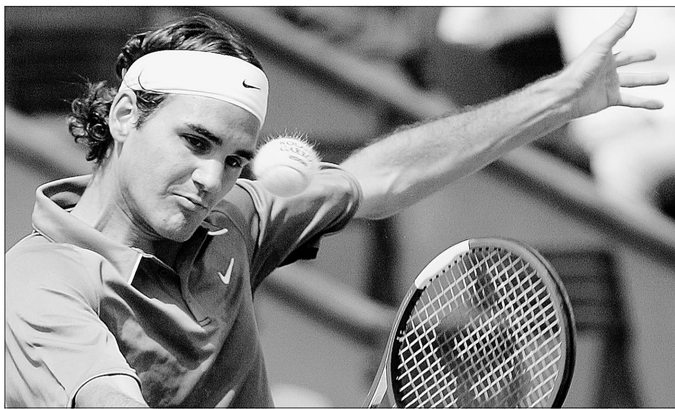
Roger Federer, secouant ses puces sur le court central de Roland-Garros, hier.

Le baseball est un sport, mais il est aussi un divertissement. Et nous voulons tous être divertis, même si nous sommes parfois trop hypocrites pour le reconnaître.