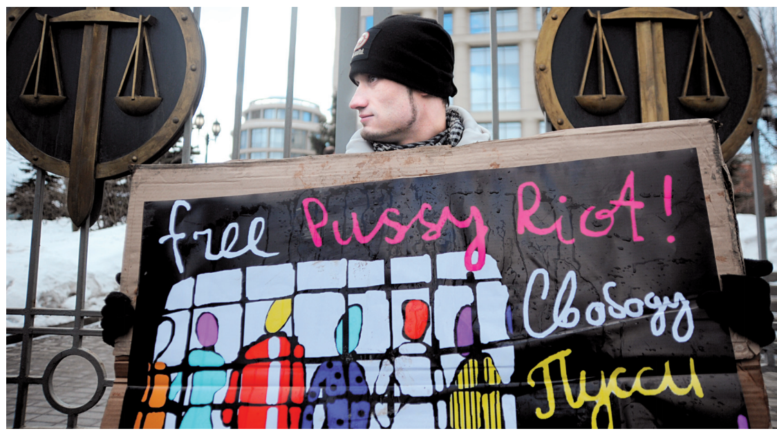
Un sympathisant des Pussy Riot manifeste devant la cour de Moscou.

Lire aussi › Avec un logis vient l'espoir. Malgré les résultats encourageants, les responsables du projet Chez soi restent prudents. Page A 6