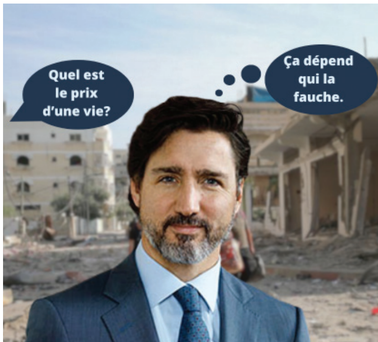
À Gaza, plus de 1 400 enfants ont été tués en moyenne chaque mois, contre 23 en Ukraine. Où sont les condamnations et les sanctions du Canada à la hauteur de ces crimes?

À Gaza, selon les grandes organisations internationales humanitaires et de droits humains, l'échelle des violations du droit et des souffrances infligées aux humains est sans précédent. L'ampleur de la destruction généralisée des infrastructures est sans précédent. La rapidité avec laquelle toute une population a été plongée dans une situation de famine est sans précédent. Jamais une crise n'a vu autant d'agences et de rapporteurs spéciaux des Nations Unies sonner l'alarme. À répétition. Sans compter qu'en août 2024, l'organisation israélienne B'Tselem a publié un