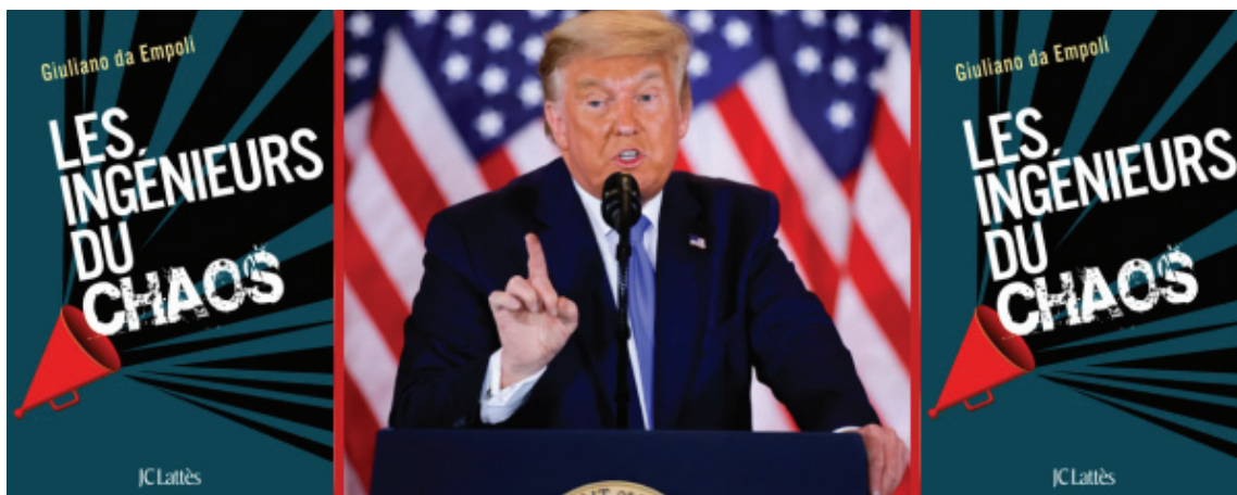
« N'être jamais ennuyant » est la seule règle que suit rigoureusement Trump. Son mérite historique, selon da Empoli, est d'avoir compris que la campagne présidentielle est un show télévisé très médiocre.

Ni parti, ni association, le Mouvement était en réalité un blogue appartenant à Grillo et Casaleggio. Les adhérents ne pouvaient communiquer