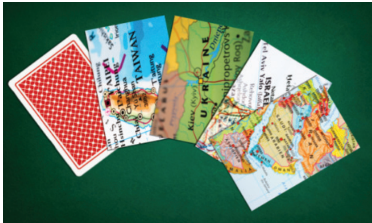
Les cartes planétaires sont à la veille d'être redistribuées, quelle que soit la prochaine présidence des États-Unis.

Il est inconcevable pour moi que la souveraineté du Québec ait lieu dans une période de tranquillité et de stabilité mondiale parce que le statut provincial du Québec fait partie d'un certain ordre du monde. Cet ordre du monde a été façonné largement par l'Empire britannique qui a créé le Canada, et il s'est prolongé tout en étant modifié sous la domination américaine. Ce système politique mondial entre maintenant de toute évidence dans une période de crise qui peut conduire à une transformation profonde.