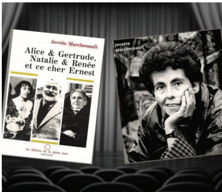
Alice & Gertrude, Natalie & Renée et ce cher Ernest s'inscrit dans ce projet de la dramaturge (également sculptrice et romancière), « déterreuse de femmes », de réhabiliter la culture des femmes.