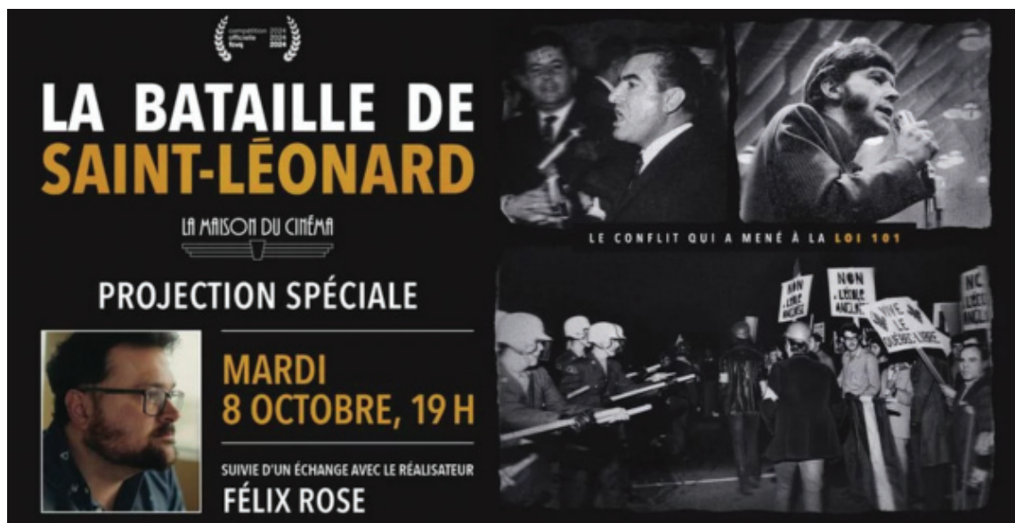
La langue est d'abord une question politique au Québec. Le documentaire de Rose montre que, bien au-delà de la peur de l'éventuelle assimilation et acculturation des nôtres, la question linguistique est celle du pouvoir politique.

Rose déploie dans son film toute son humanité, qui lui permet de mener des entrevues franches avec ses intervenants comme dans Les Rose et Québec rock: Offenbach vs Corbeau . Juxtaposant des entrevues actuelles aux très belles images d'archives, le documentaire a le