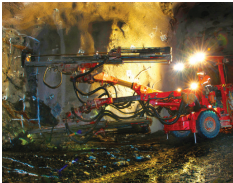
Le gouvernement va-t-il tenir compte des doléances des résidents qui s'inquiètent au sujet des impacts sur la sécurité de la population vivant autour de la future mine?

Plusieurs contaminants potentiellement cancérigènes et cancérogènes sans seuil contaminent déjà la ville de Rouyn-Noranda et dépassent les normes. La documentation est abondante sur le sujet depuis le dépôt des études de biosurveillance de 2018 et 2019 et des études de l'INSPQ qui ont suivi. Le dévoilement du document de l'annexe 6 retenu par le docteur Aruda et finalement rendu public a été le moment d'une prise de conscience collective des dangers sur la santé.