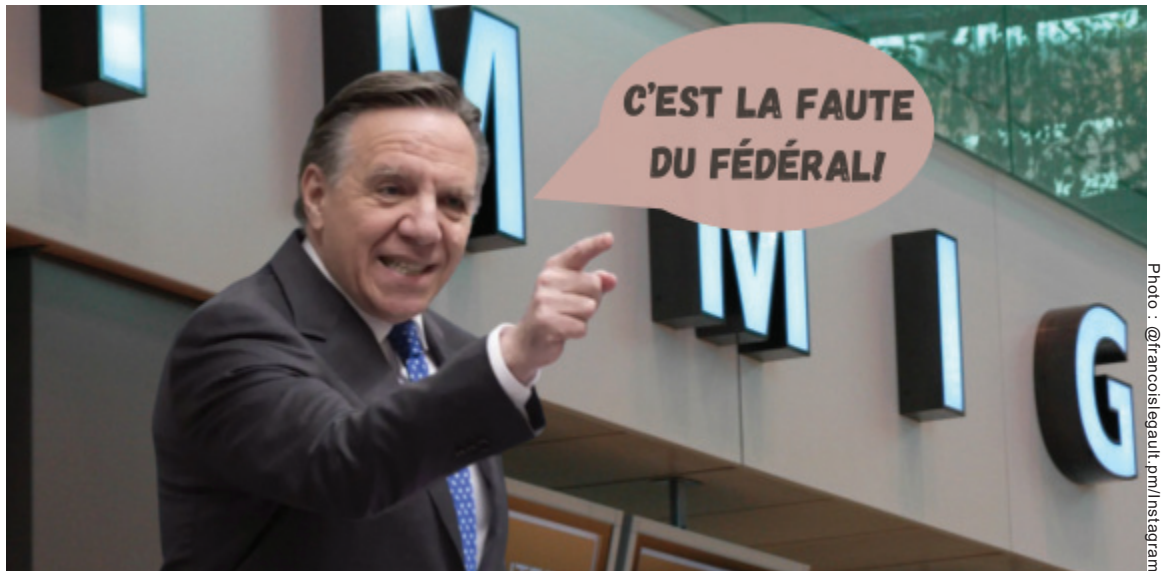
Suggérer que ce n'est que le fédéral qui peut réduire le nombre de personnes à statut temporaire au Québec, ou même que le fédéral contrôle la grande majorité de ces permis est faux.

De plus, le Québec s'est entendu avec le fédéral sur une liste de près de 300 occupations pour lesquelles les employeurs n'ont pas l'obligation d'afficher localement. Il est le seul gouvernement provincial avec une telle entente. Ce n'est que tout récemment que la ministre Fréchette a agi pour baisser le nombre de RNP avec l'annonce d'une suspension de six mois des approba-