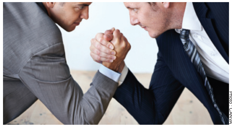
Nous avons tendance non seulement à réduire toute discussion en débat, mais, surtout, à concevoir ce dernier comme une lutte sans merci.

Nous n'avons peut-être pas « oublié » ou « perdu » l'art du débat démocratique, pour la simple raison que, n'ayant pas été formés en ce sens,