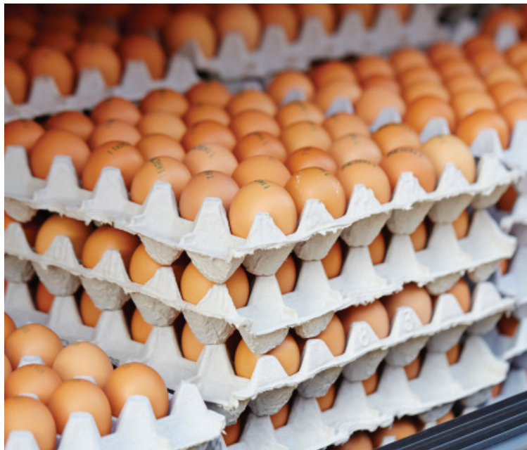
Plus du tiers de l'agriculture québécoise dépend du programme de la gestion de l'offre dont le gouvernement voudrait se servir comme monnaie d'échange.

Le Directeur parlementaire du budget a estimé le coût de cette mesure à trois milliards $ par année, soit 0,57 % du budget fédéral. Lorsqu'un projet de loi qui entraîne de nouvelles dépenses est présenté par un député de l'opposition, le gouvernement doit lui octroyer la « recommandation royale », sans quoi