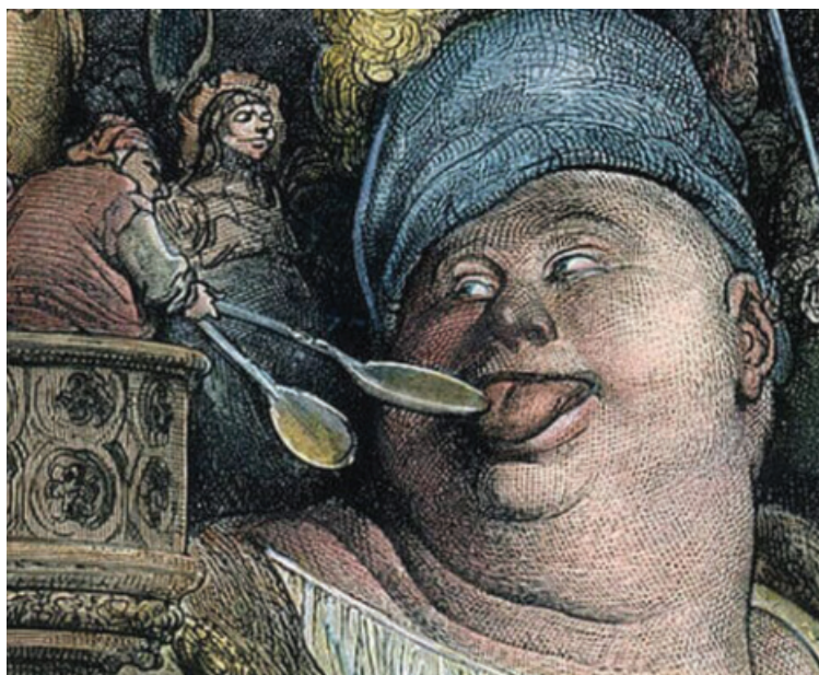
« Ventre affamé n'a pas d'oreilles », dit la maxime. Mais il y a aussi ceux qui n'ont pas d'oreilles pour les ventres affamés. Aucune compassion pour cet abonné aux meilleures tables parisiennes.

Devant la levée de boucliers, MBC a cru nécessaire de pondre une deuxième chronique (10 septembre 2024) dans laquelle il se transforme en chef cuisinier, porte-parole de l'industrie du porc,