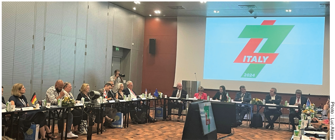
Les représentants des organisations syndicales ont mis l'accent sur le rôle clé que jouent les syndicats et la négociation collective pour favoriser la cohésion sociale et la confiance dans les politiques publiques.

Un constat s'est imposé au début de la discussion. La démocratie est en détresse et l'extrême droite gagne du terrain dans de nombreux pays du G7 et au-delà. À une époque de fortes tensions géopolitiques, d'inégalités croissantes et de polarisation, les représentants des organisations syndicales ont mis l'accent sur le rôle clé que jouent les syndicats et la négociation collective pour favoriser la cohésion sociale