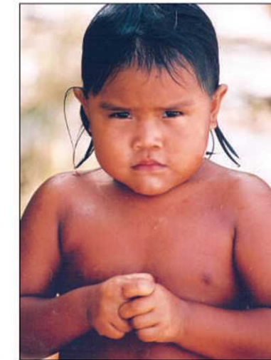
Un jeune indien

puis le campement de Canaima pour remonter les rapides des rivières Carrao et Churum jusqu'au canyon du Diable et aux chutes Angel. Une expédition hors des sentiers battus.