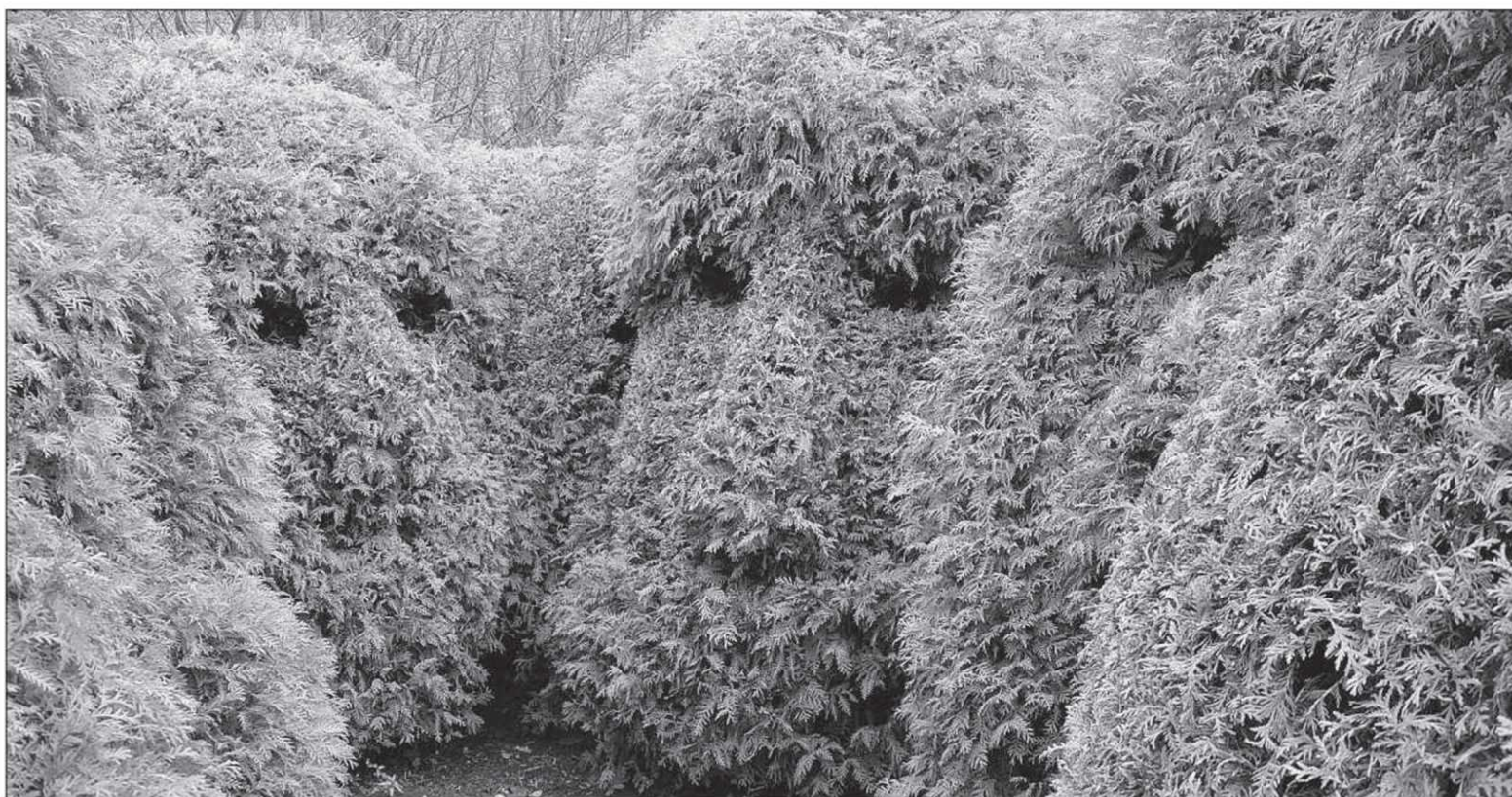
Un conseil de guerre a été sculpté dans les thuyas au parc de Séricourt, près de Vimy, en France.