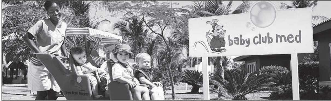
Les enfants prennent part à des activités organisées en fonction de leur âge.

C'est à grands renforts de millions de dollars, 34 en l'occurrence, qu'on a refait une beauté au village famille de Punta Cana, en République dominicaine. On y trouve désormais tout le luxe des resorts haut de gamme avec, en prime, des programmes d'activités spécifiquement élaborés pour les enfants et les ados.