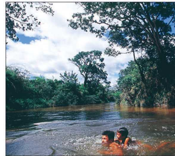
Canaima est le plus célèbre des parcs nationaux du Venezuela.