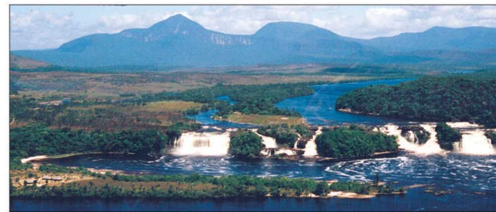
La lagune de Canaima à vol d'oiseau

Si les plages de l'île de Margarita et de l'archipel Los Roques attirent de nombreux touristes, le parc de Canaima et les chutes Angel demeurent un incontournable. C'est sans contredit l'un des plus beaux sites naturels de l'Amérique du Sud. C'est ce que le Venezuela a de plus spectaculaire à offrir. C'est dans la région de la Gran Sabana, située à la limite de l'Amazonie, que l'on trouve les tepuys, les grands plateaux qui ont donné naissance aux chutes Angel, le Churum Meru dans la langue des Indiens. Les tepuys de la Gran Sabana sont comme des îles isolées émergeant à quelques milliers de mètres au-dessus de la forêt équatoriale, chacune ayant développé une faune et une flore endémiques. Le parc de Canaima, situé au cœur de cette région sauvage, est le plus grand et le plus célèbre des parcs nationaux du Venezuela, et pour cause. On y va pour voir de ses propres yeux les chutes Angel, les plus hautes du monde avec près de 1000 mètres (979 mètres pour être plus précis), soit 15 fois celles du Niagara. C'est de Puerto Bolívar, situé sur les rives de l'Orénoque à six heures de route de Caracas, que partent la plupart des avions légers pour le bout du monde. Des circuits de trois jours et deux nuits sont organisés de-