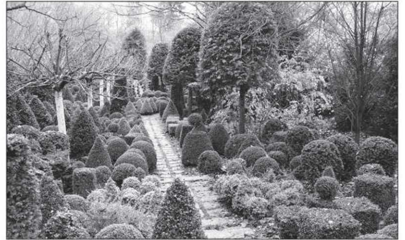
Les ifs et les buis du jardin des topiaires

Au jardin des topiaires, les ifs et les buis sont très serrés, ils prennent des formes, des hauteurs et des couleurs différentes. Cet endroit charmant donne envie de s'arrêter à chaque pas pour bien repérer toutes les plantes dans leur diversité et leur individualité. Au gré de son imaginaire, le visiteur peut y voir un petit musée ou l'expression de la diversité humaine. Au détour de l'allée des topiaires, on découvre un salon végétal. Un canapé et deux fauteuils tendent leurs bras au visiteur; mais cette sculpture est virtuelle.