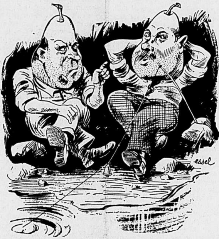
— Les propriétaires, y s'ambitionnent si tu les laisses faire!... Tiens, l'année dernière, je m'loue un logement... Ça faisait pas trois mois que j'étais installé, qu'est-ce que j'aperçois?... Y avait même pas de salle de bain!