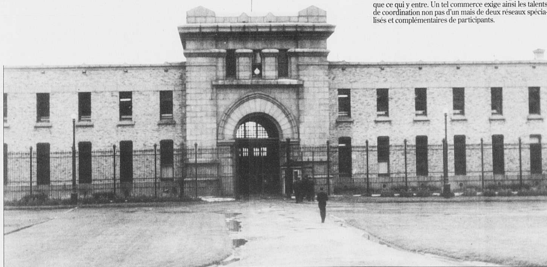
L'ÉQUIPE DU DEVOIR