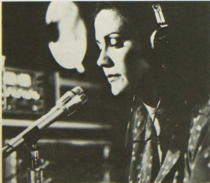
«La Dernière Mélodie»

On a dit avec raison que la guerre chimique n'est pas le sujet le plus naturel pour une comédie de style loufoque.