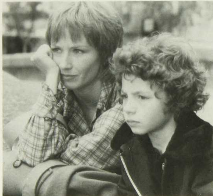
«Va voir maman... papa travaille»

C'est un film tourné pour la télévision qui a remporté un certain succès aux États-Unis.