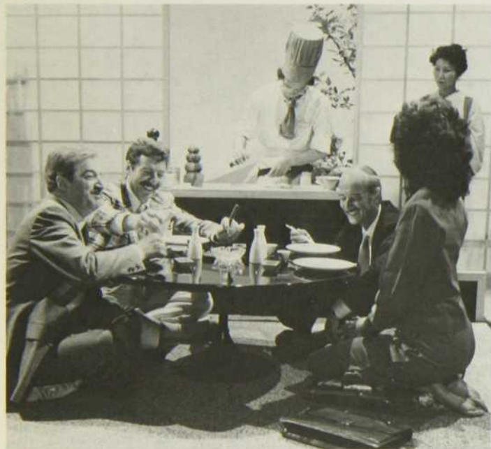
Roger Lebel, Michel Forget et Fernand Gignac