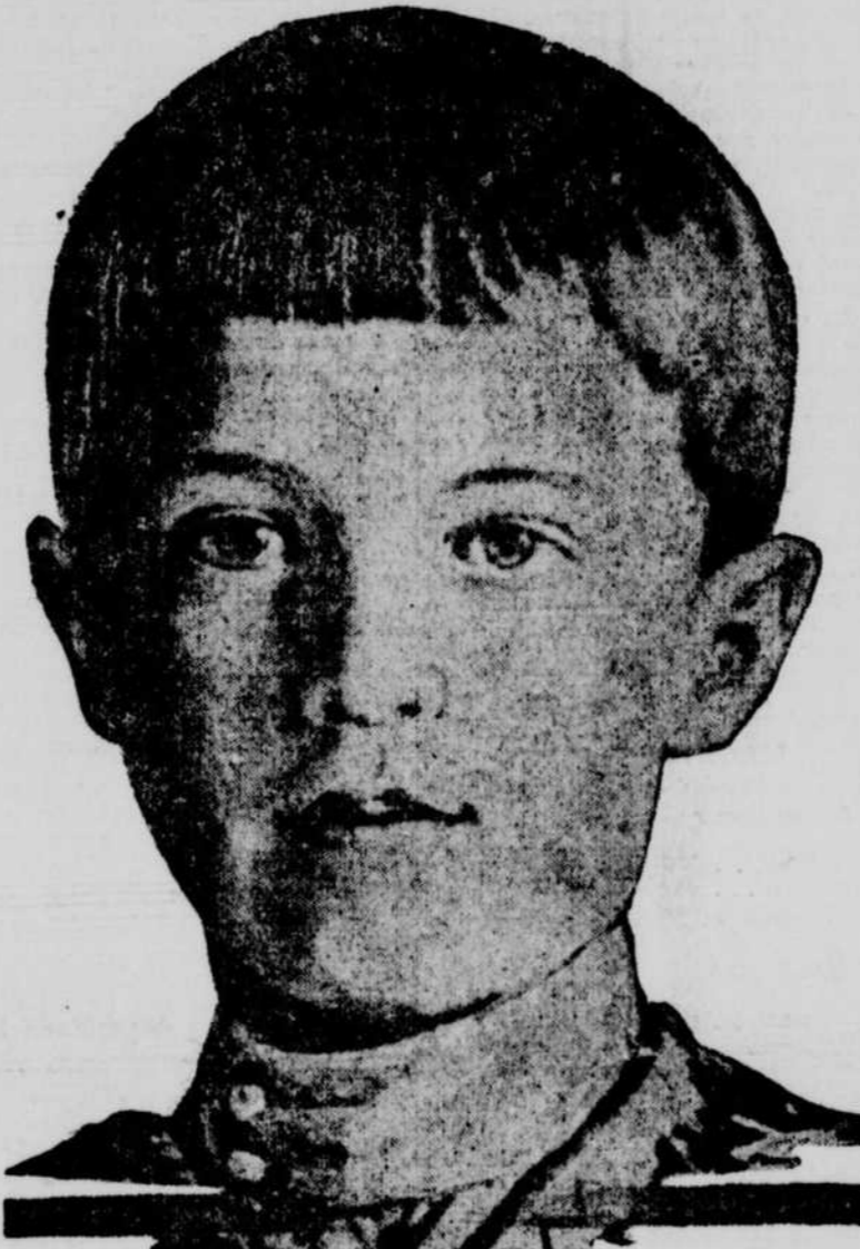
Le tsarvitch qui vient d'être proclamé empereur de la Russie.

Des dépêches de Copenhague annoncent que le fils de l'ex-tsar Nicolas, le grand-duc Alexis aurait été proclamé tsar et le grand-duc Michel Alexandrovitch, régent