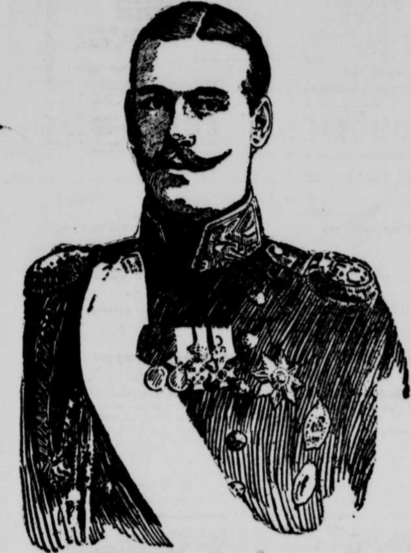
Le grand duc MICHEL ALEXANDROVITCH qui vient d'être nommé régent de la Russie.

Stockholm, 28. — A la dernière minute, la rumeur accréditée de plus en plus à l'effet que le grand-duc Alexis a été fait empereur de Russie avec le grand-duc Michel Alexandrovitch comme régent. Il est également rumeur que le nouveau gouvernement refusera de reconnaître le traité de paix passé entre l'Allemagne et le gouvernement Bolcheviki.