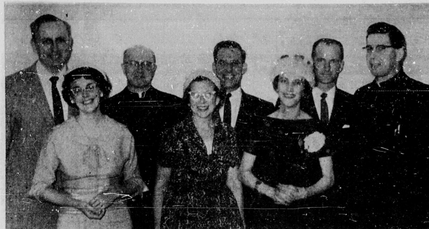
BANQUET DE CLOTURE—A la suite de cours sur les problèmes de la vie conjugale...