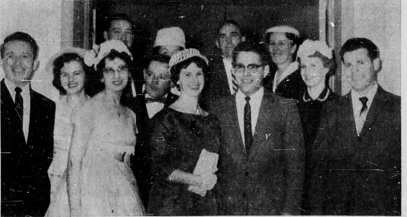
"LES FOYERS HEUREUX" de la paroisse Saint-Eugène de Sudbury ont participé à un banquet pour marquer la bénédiction de leur groupe...