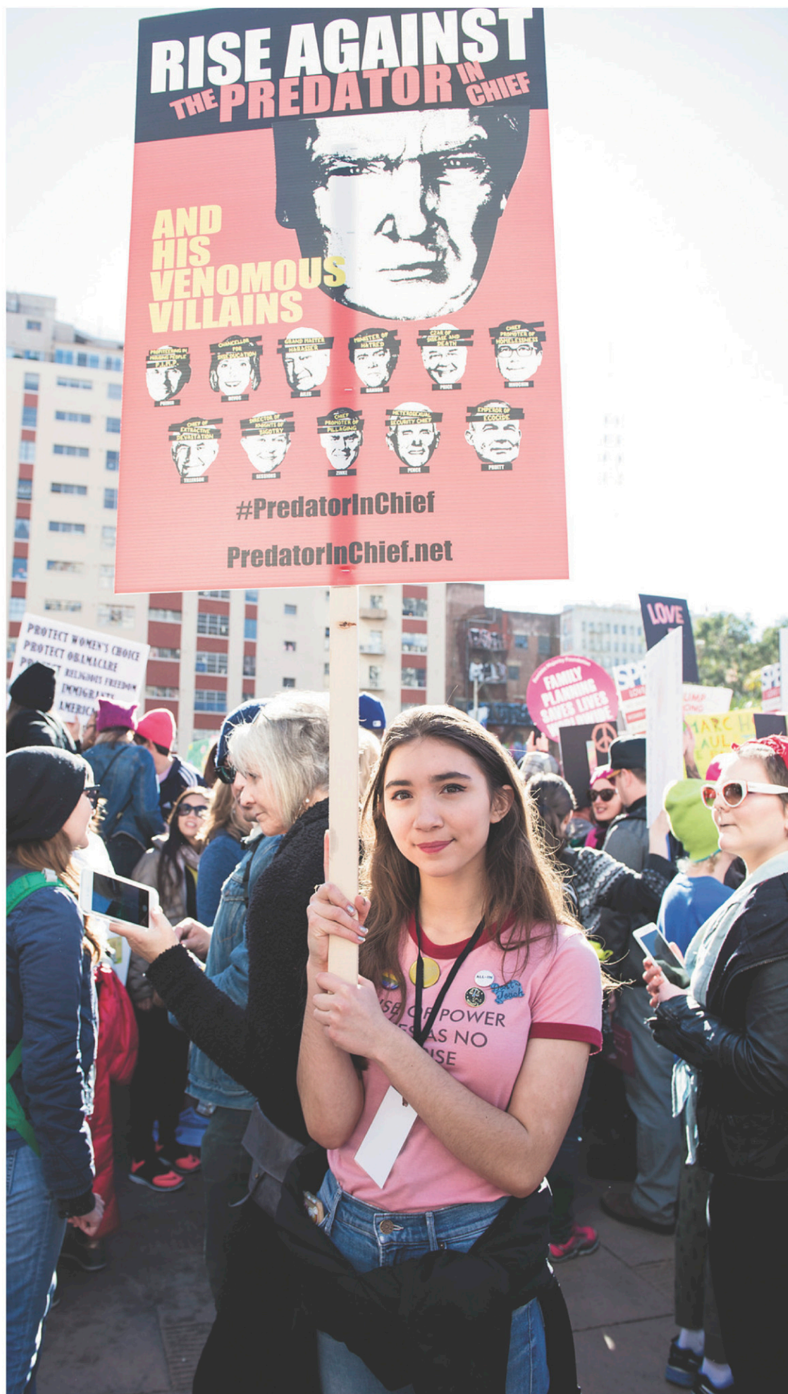
La jeune actrice Rowan Blanchard, 15 ans, a électrisé 750 000 personnes à Los Angeles, durant la Marche des femmes contre Donald Trump, par un discours empreint de maturité.

Ce qui n'est pas plus vrai qu'hier, et pas pire que chez les adultes. La véritable adolescence contemporaine, ce sont des jeunes de plus en plus stressés, qui se sentent responsables de leur parcours de plus en plus tôt, et sont maintenant écrasés par ces petits génies qu'on leur agit sous le nez comme modèles d'exemplarité. »