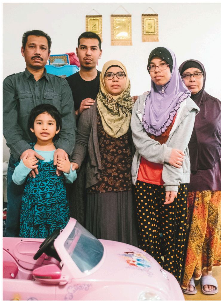
RENAUD PHILIPPE LE DEVOIR

Au Québec, les nouveaux arrivants peuvent passer le test dans leur langue jusqu'à trois ans après leur arrivée. Les tests sont offerts en français, anglais, arabe, mandarin et espagnol. Pour les autres langues, il est possible de le faire avec interprète à Montréal.