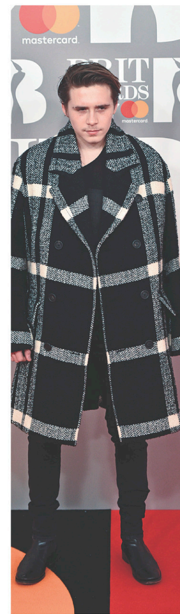
Brooklyn Beckham, mannequin