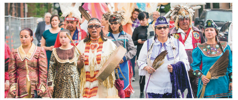
Marche à Montréal lors de la Journée nationale des autochtones