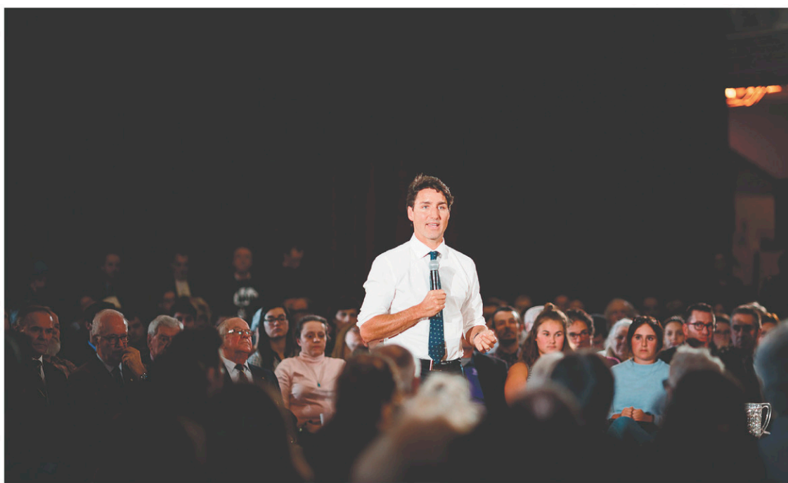
GUILLAUME LEVASSEUR LE DEVOIR

Y a-t-il lieu de s'étonner quand le premier mi-