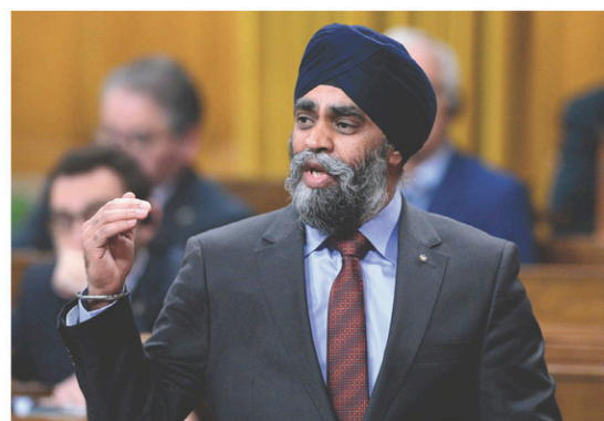
Le ministre de la Défense, Harjit Sajjan