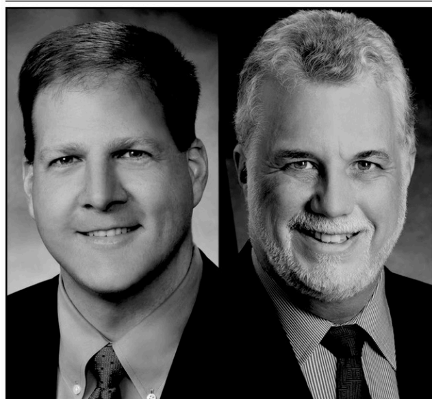
Chris Sununu Gouverneur du New Hampshire Philippe Couillard Premier ministre du Québec