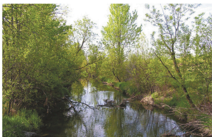
Le projet immobilier Cap Nature compte 5500 logements et prévoit la protection de 180 hectares de milieux naturels.

Entrevue avec la nouvelle directrice générale de l'Institut du Nouveau Monde