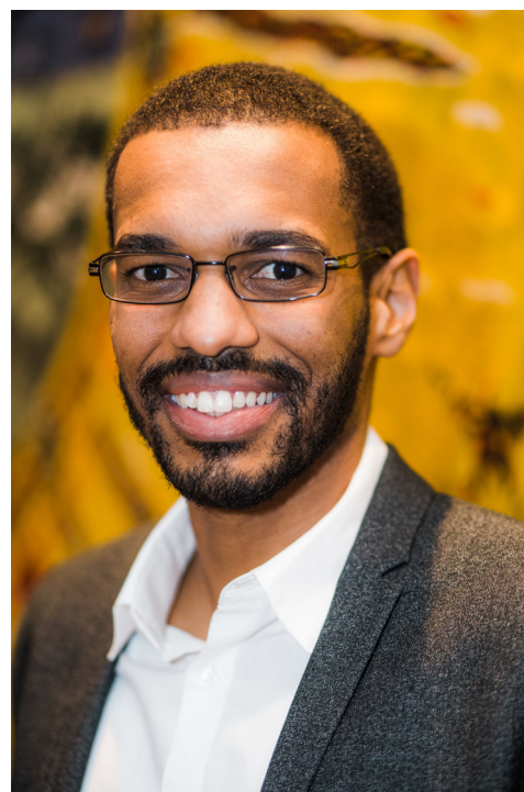
Le président du CIM, Moussa Sène

Le CIM a produit plusieurs documents de travail en 2017 en plus d'entamer un travail de réflexion important autour de la réalisation de deux avis qui seront déposés en 2018. En effet, le Conseil interculturel de Montréal a notamment produit un avis faisant le bilan, 10 ans plus tard, de son avis sur le profilage racial de 2006. Le CIM s'est aussi engagé dans la production d'un avis sur la participation citoyenne des personnes issues de la diversité et d'un mémoire en faveur d'une politique interculturelle pour la Ville de Montréal.