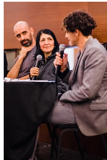
Table ronde Les enjeux de l'intégration dans le milieu de l'art et la culture , 30 novembre 2017.

28 – 29 novembre : Rencontre des Cités interculturelles organisée par le Conseil de l'Europe et la Ville de Lisbonne à Lisbonne au Portugal.