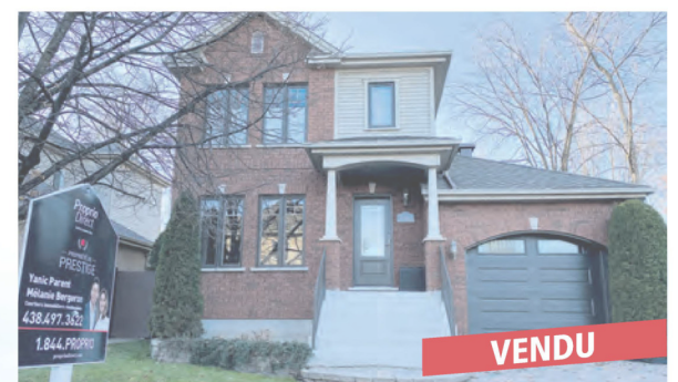
Longueuil, 1542 rue du Bordelais

Nos bureaux sont situés à Saint-Basile-le-Grand (Face au Lac Montpellier)