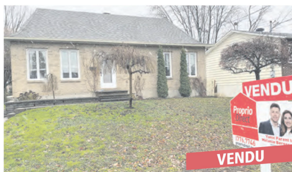
Saint-Basile-le-Grand, 62 rue Champagne