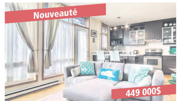
Montréal/Ville-Marie, 1886 rue Poupart