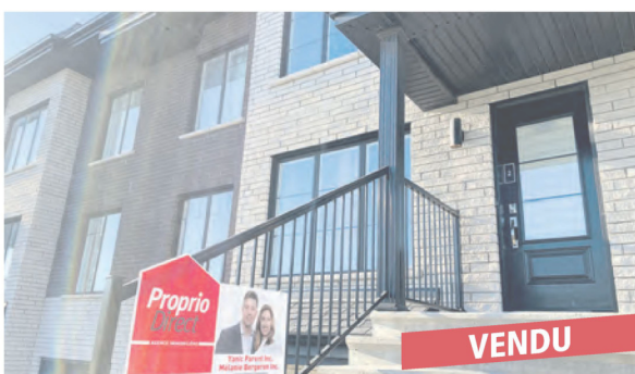
Saint-Basile-le-Grand, 269 rue Prévert / app.2