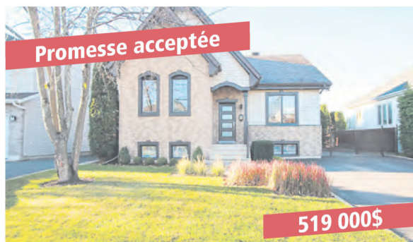
St-Basile-le-Grand, 14 rue des Frères-Chasseurs