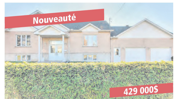
Ste-Anne-de-Sabrevois, 200 / 2e Avenue