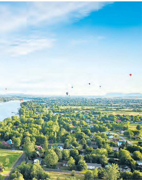
Vallée-du-Richelieu n'est plus la même du point de

nant représentée par plusieurs nouveaux maires. »