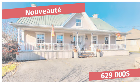
Beloeil, 1076 boul. Yvon L'Heureux