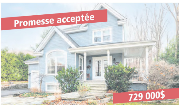
Mont St-Hilaire, 210 rue Louis-Ducharme