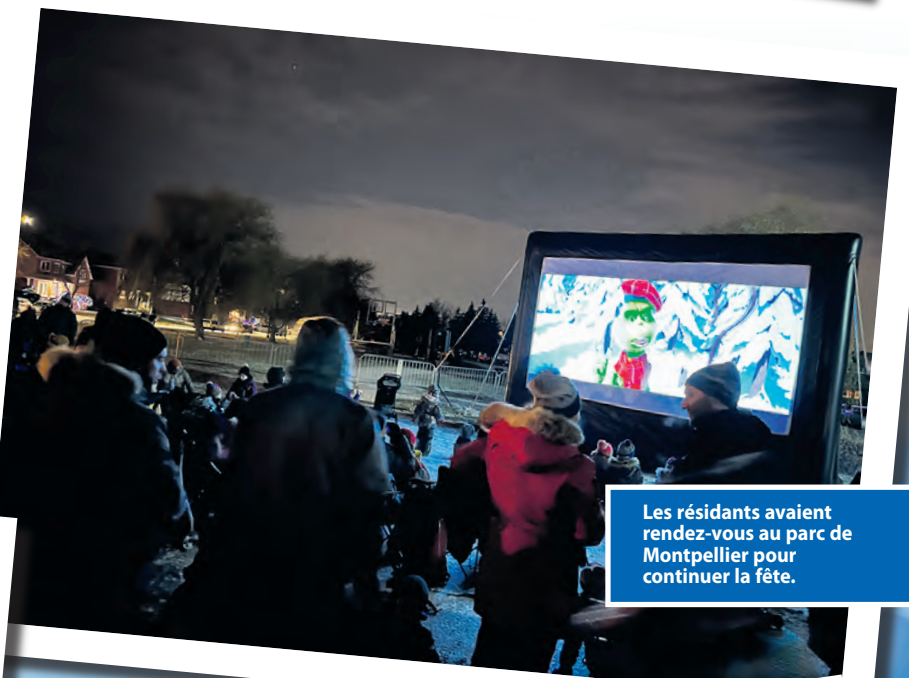
Les résidents avaient rendez-vous au parc de Montpellier pour continuer la fête.