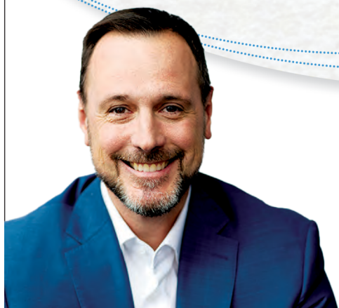
JEAN-FRANÇOIS ROBERGE Député de Chambly