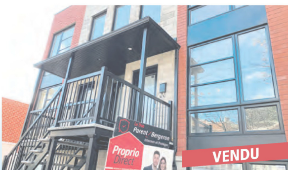
Montréal, 3030 Monsabre