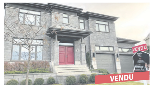
Saint-Basile-le-Grand, 10 rue de la Bernache