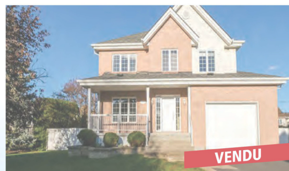
Saint-Basile-le-Grand, 133 rue Lorraine