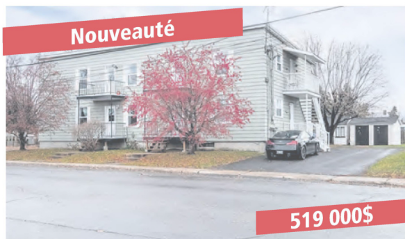
Marieville, 355-361 rue Ouelette

98,5 fm MONTREAL En onde au 98,5 FM Le dimanche à 11 h.