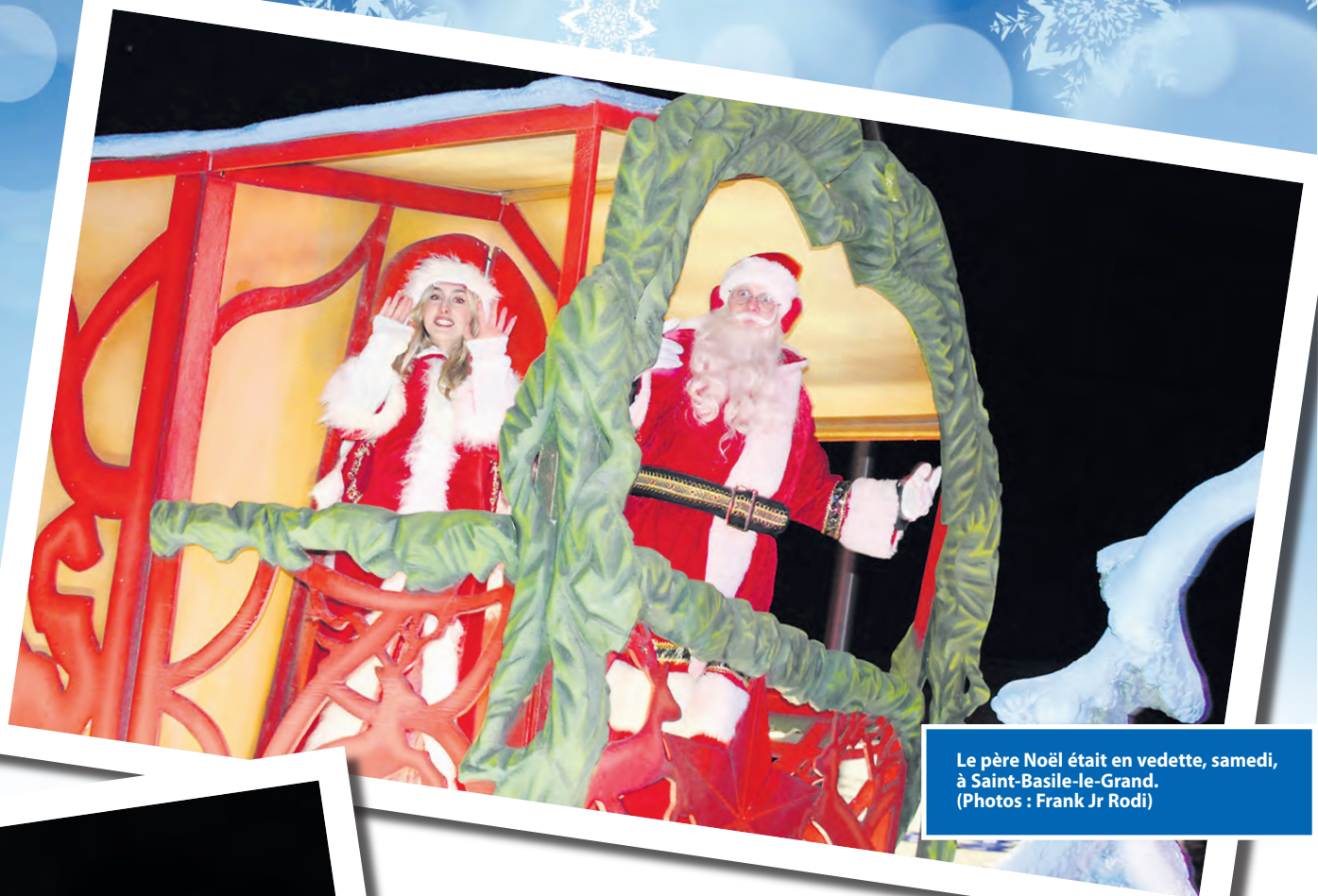
Le père Noël était en vedette, samedi, à Saint-Basile-le-Grand.