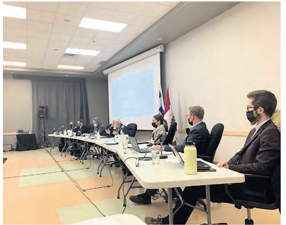
Les élus du conseil municipal durant la séance du 22 novembre dernier, placés dans l'ordre des districts qu'ils représentent avec le maire au centre.

La prochaine séance du conseil municipal se tiendra le 6 décembre prochain, à