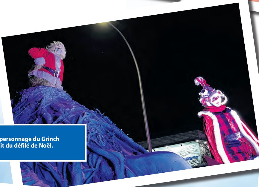
Le personnage du Grinch était du défilé de Noël.