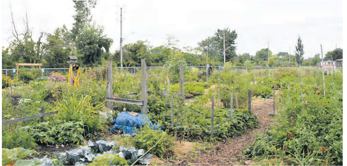
L'APES gérait les jardins du parc des Cheminots (photo) et du parc Duquet, tous deux à Saint-Basile.

Ledit dossier, qui fait quatre pages, décrit en détail les problèmes que disent subir les