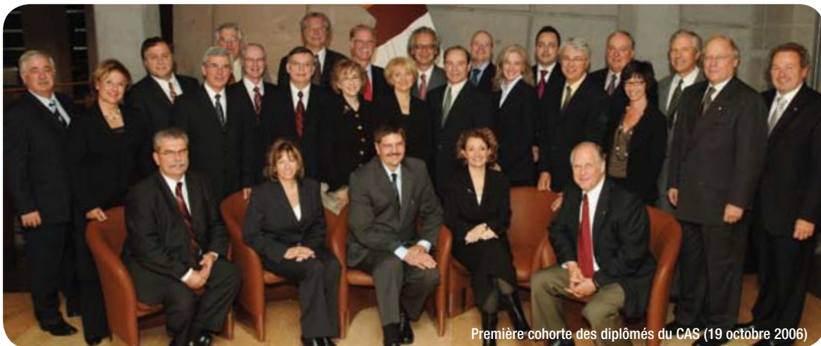
Première cohorte des diplômés du CAS (19 octobre 2006)

« Nous considérons que les premiers diplômés du Collège sont aujourd'hui mieux outillés pour siéger aux conseils d'administration. Ils mettront en place de nouvelles règles de bonne gouvernance et appuieront leurs actions sur des valeurs d'excellence, d'éthique et d'ouverture. »