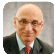
Yves Filion Président Conseil international des grands réseaux électriques (CIGRE)