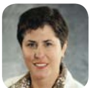
Anne-Marie Poitras Surintendante Autorité des marchés financiers