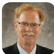
Yves C. Renaud Gestion CY Renaud