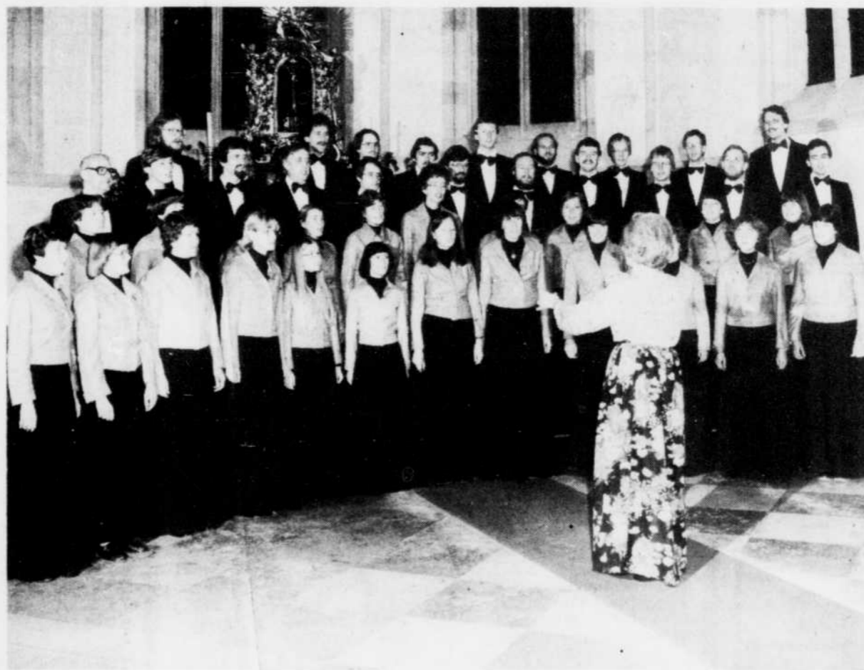
Le Choeur étudiant Madrigal, de Munster en Allemagne.