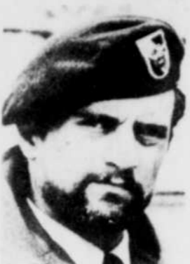
Robert de Niro

Robert de Niro va tourner sous la direction du