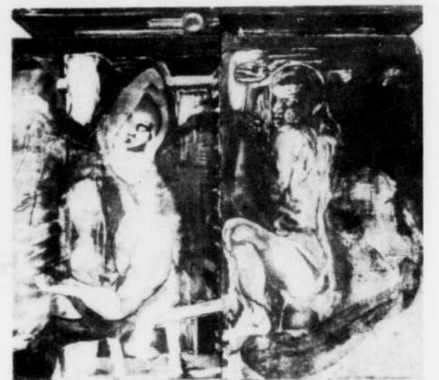
Family Sleeping, Bunk Beds, B. Fisher, 1983

La Hongrie et le monde entier ont commémoré, en 1982, le 100e anniversaire de la naissance de Zoltan Kodaly (1882-1967), le grand compositeur, l'éminent musicologue et ethnomusicologue, un champion infatigable, durant toute son existence, de l'éducation musicale des masses. Plus de deux cents compositions, dont une grande partie de renommée mondiale, un nombre sensiblement semblable de livres, d'études et d'articles forment l'oeuvre continuellement enrichi jusqu'à sa mort du great old man de la culture musicale hongroise, de l'un des musiciens les plus marquants de notre siècle. Ses oeuvres symphoniques ou de musique de chambre sont souvent exécutées dans les salles de concert du monde entier et d'innombrables enregistrements discographiques leur ont été consacrés avec le concours des interprètes les plus réputés de la vie musicale internationale. La présente exposition, présentée grâce à l'Ambassade de Hongrie et au Programme international des Musées nationaux du Canada, retrace les grandes étapes de sa vie et de sa carrière.