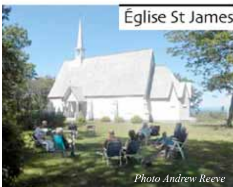
Église St James