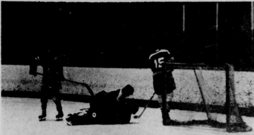
Le hockey mineur à St-Joseph-de-Sorel connaît une saison exceptionnelle. Nul doute que les séries éliminatoires de-

Avec trois médailles dans le patinage de vitesse