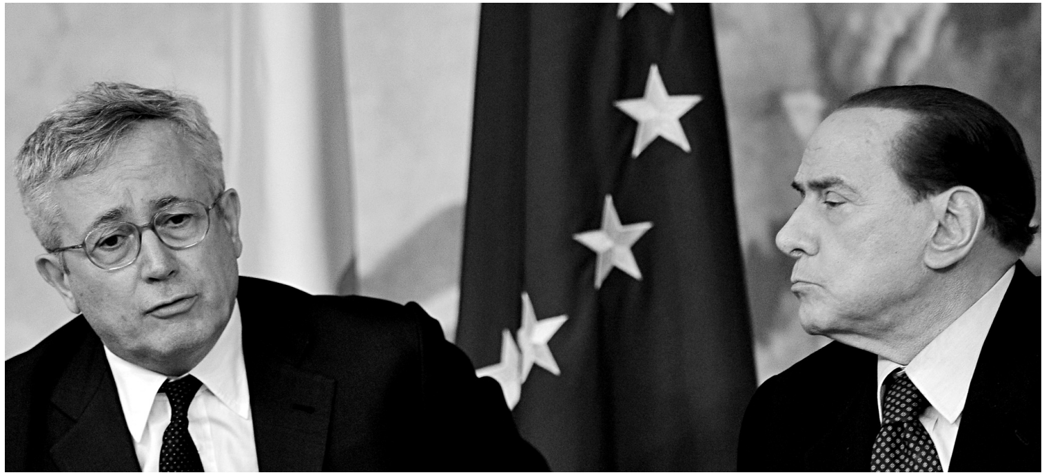
Le premier ministre d'Italie, Silvio Berlusconi (à droite), et son ministre des Finances, Giulio Tremonti.