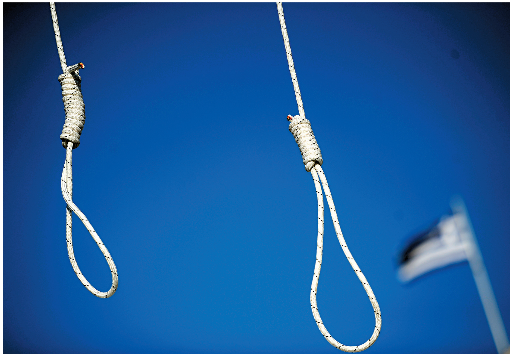
Deux cordes nouées se balancent dans le ciel bleu devant le parlement grec, dont on aperçoit le drapeau en arrière-plan. Les Grecs se sentent étranglés par les exigences de l'UE et du FMI, mais sans l'adoption du deuxième plan d'austérité plus tôt cette semaine, le pays se serait retrouvé en position de faillite.