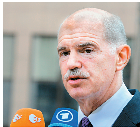
GEORGES PAPANDRÉOU