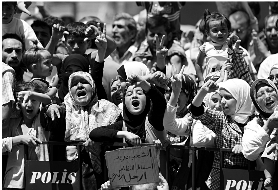
Des Syriens réfugiés en Turquie ont également manifesté hier.