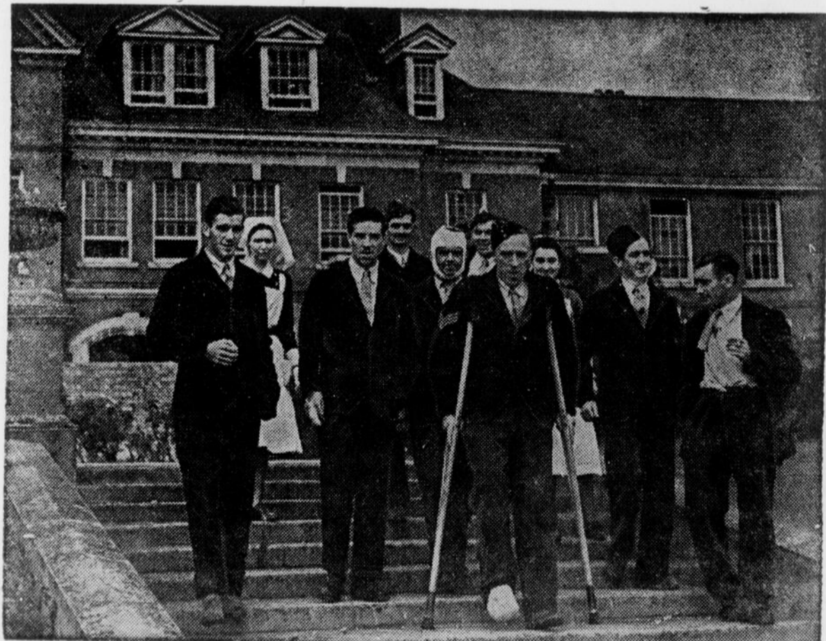
Quelques combattants originaires de la Province de Québec, en face d'un hôpital de la Croix-Rouge canadienne, en Angleterre. La Croix-Rouge envoie des fournitures aux centres et aux hôpitaux militaires.