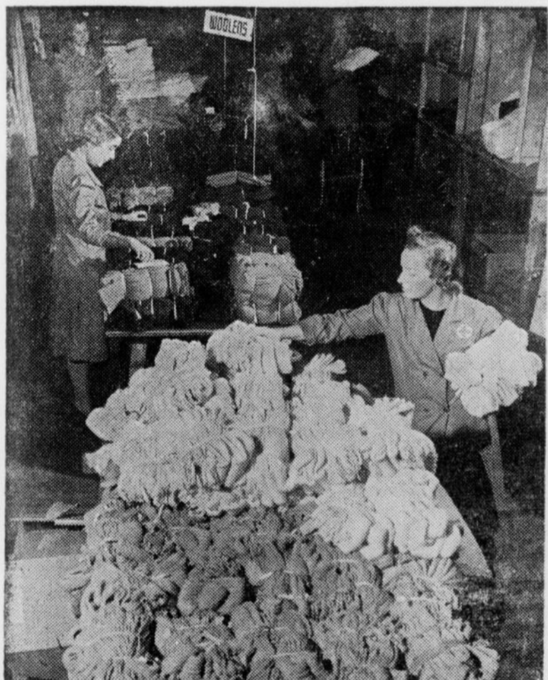
Les articles confectionnés dans les 185 sections de la Croix-Rouge de notre province sont inspectés, classés et empaquetés à la Maison de la Croix-Rouge, à Montréal.

DONNEZ — L'humanité souffre aujourd'hui plus que jamais