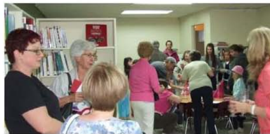
La Biblio d'Eugélit en fête le 7 juin