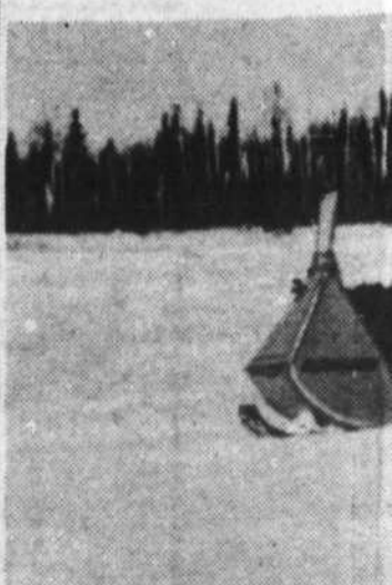
C'est à l'aide de trains motorisés transportant pour y marquer