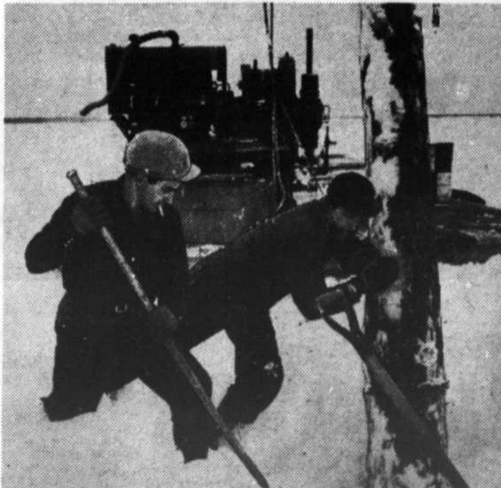
Toute l'équipe scientifique collabore à l'élévation des appareils de sondage, la glace facilitant les choses.