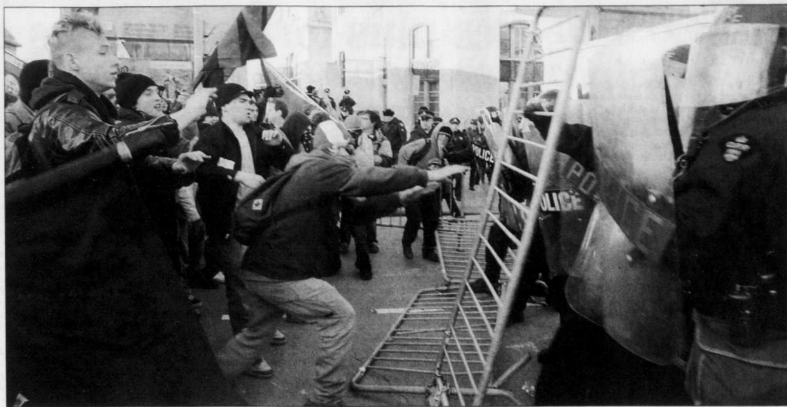
Les manifestants ont fait tomber des barrières de sécurité et affronté les forces de l'ordre devant un grand hôtel d'Ottawa où logeaient certains membres de l'entourage du président américain.