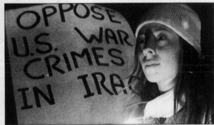
Chacun avait sa raison de manifester contre George W. Bush. Celle-ci s'oppose à l'intervention militaire en Irak.

Bush sera dans les Maritimes aujourd'hui