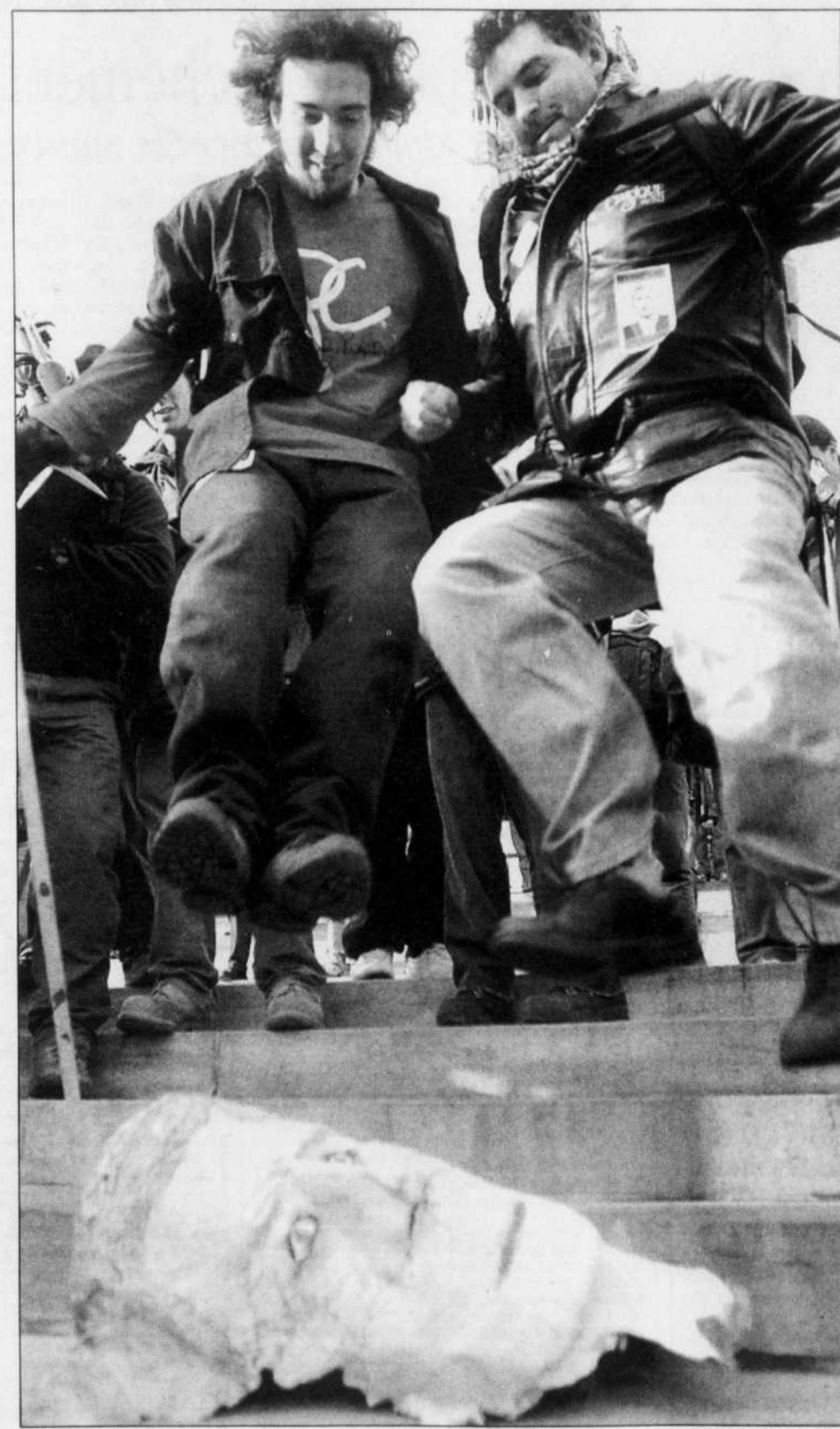
Des manifestants ont piétiné un masque à l'effigie de George W. Bush.