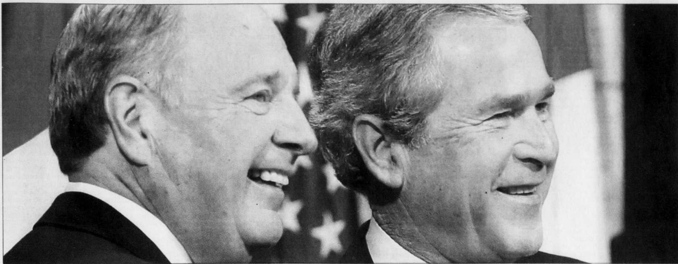
Le premier ministre Paul Martin et le président américain George W. Bush, hier, à Ottawa. La rencontre a donné lieu à un changement de ton dans les relations canado-américaines.