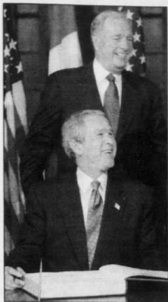
George W. Bush a signé le livre d'or avant d'engager les discussions avec Paul Martin.