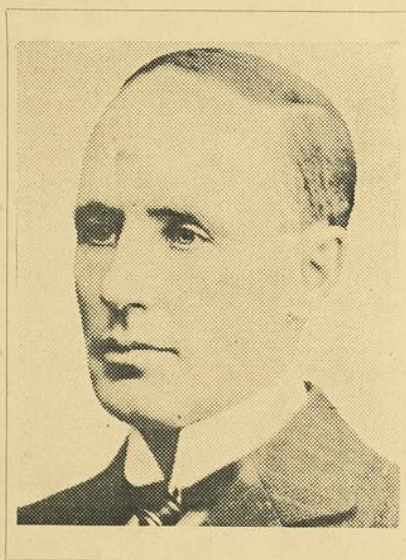
TRÈS HONORABLE ARTHUR MEIGHEN PREMIER MINISTRE DU CANADA

1913 1914 1915 1916 1917 1918 1919 1920 1921 1922 1923 1924 1925 1926 1927 1928 1929 1930 1931 1932 1933 1934 1935 1936 1937 1938 1939 1940 1941 1942 1943 1944 1945 1946 1947 1948 1949 1950 1951 1952 1953 1954 1955 1956 1957 1958 1959 1960 1961 1962 1963 1964 1965 1966 1967 1968 1969 1970 1971 1972 1973 1974 1975 1976 1977 1978 1979 1980 1981 1982 1983 1984 1985 1986 1987 1988 1989 1990 1991 1992 1993 1994 1995 1996 1997 1998 1999 2000 2001 2002 2003 2004 2005 2006 2007 2008 2009 2010 2011 2012 2013 2014 2015 2016 2017 2018 2019 2020 2021 2022 2023 2024 2025