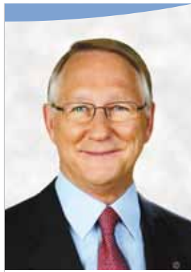
Gérald Tremblay Maire de Montréal Mayor of Montréal