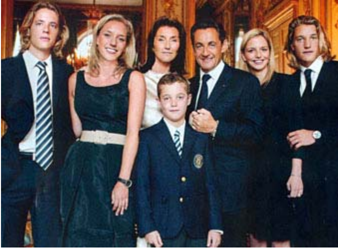
Cécilia Sarkozy et sa famille

La beauté est toujours une question de perception et de mode. L'exemple de Cécilia Sarkozy démontre bien cette réalité. L'épouse politique, âgée de 49 ans, est soudainement devenue la coqueluche des Français et elle a relégué à l'arrière-scène plusieurs femmes plus jeunes et plus provocantes partout dans le monde. Le secret de Cécilia: un grand souci du détail mais surtout une grande simplicité dans ses choix de vêtement, de bijoux et de maquillage. On dit dans certains milieux que la famille Sarkozy deviendrait une sorte de symbole comparable aux célèbres Kennedy . (Voir photos sur le site Internet) www.LeStudio1.com/CeciliaSarkozy