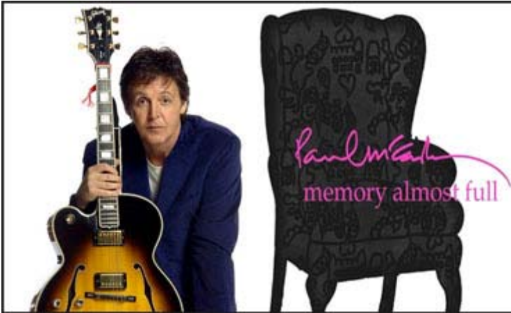
Paul McCartney et son nouvel album