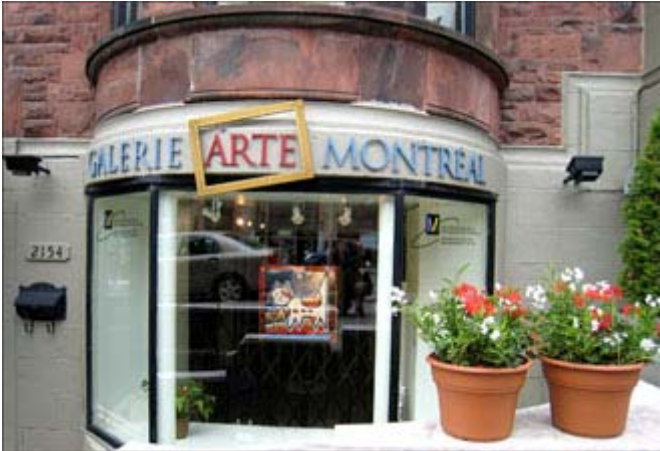
Galerie des bénévoles du Musée des Beaux-arts de Montréal

La nouvelle tendance à Montréal est une migration des galeries d'art vers divers établissements hôteliers. L'exposition itinérante de la Galerie ARTE , galerie opérée par les bénévoles du Musée des beaux-arts de Montréal , est un exemple de ce nouveau genre alors que des oeuvres seront en montre à l'hôtel Nelligan durant toute la saison estivale. Cette exposition permet à la Galerie d'augmenter son rayonnement, en dehors de son emplacement permanent, et à l'hôtel d'embellir sa décoration.