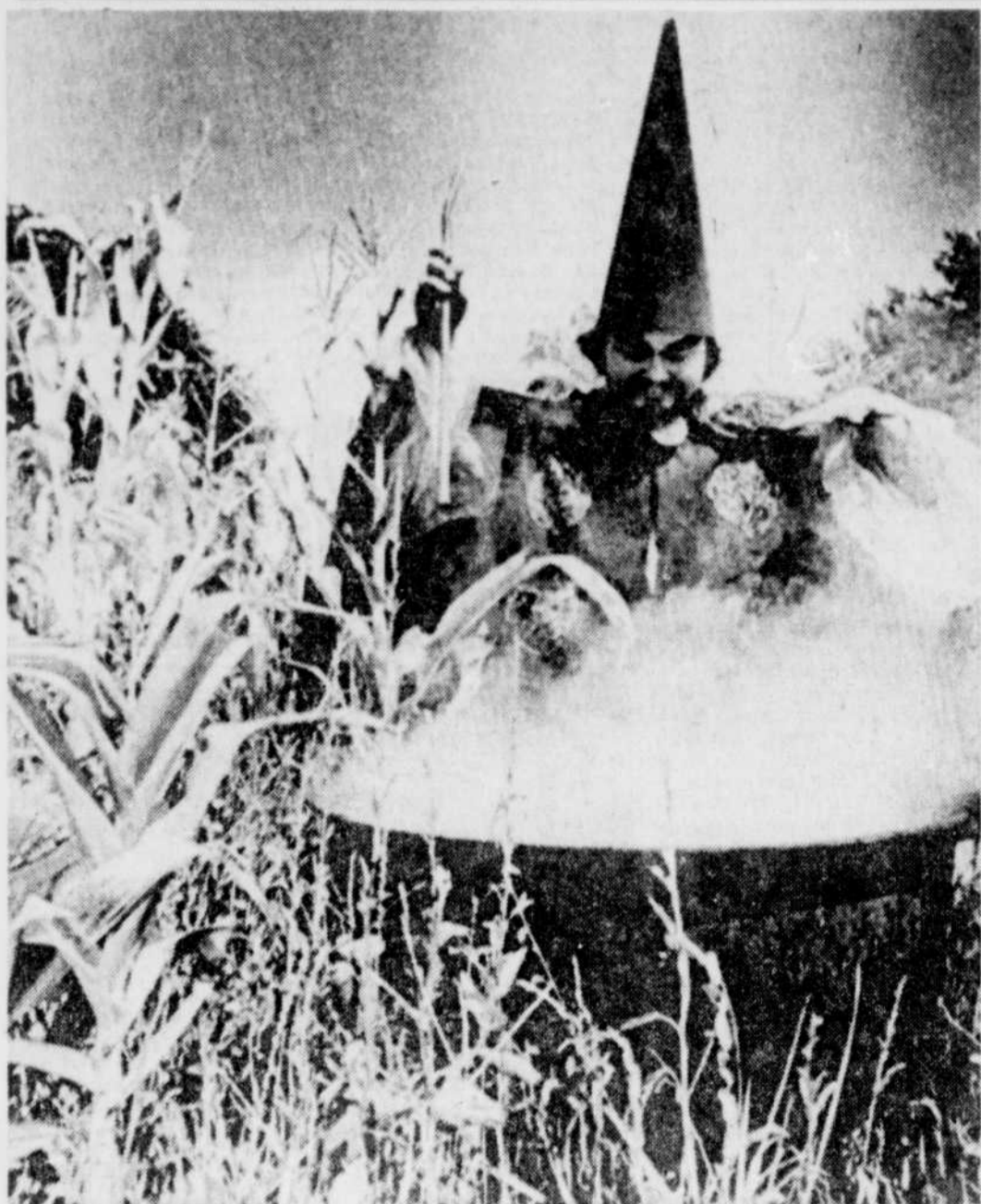
ABRACADABRA — Revêtu de son costume et brandissant sa baguette de magicien, un comédien, qui personnifie le sorcier dans une pièce présentée à l'affiche au théâtre d'été de Pittsburgh, au Kansas, conjure les esprits de faire

pleuvoir sur les plaines desséchées du Midwest américain. La sécheresse sévit, en effet, depuis plusieurs semaines, dans cette partie des États-Unis et les cultivateurs craignent pour leurs récoltes.