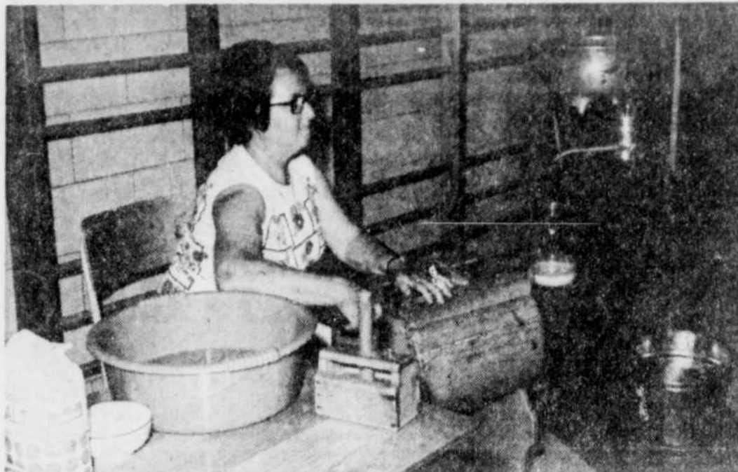
DU BEURRE DE LA FERME — Le salon de l'artisan présentait plusieurs techniques anciennes, dont celle du beurre. Deux fois