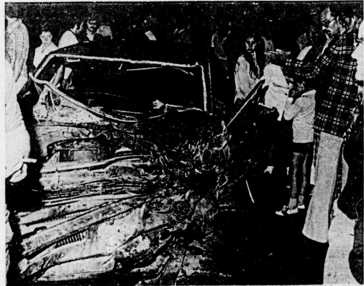
Un mort et deux blessés, à Neufchâtel Une violente collision a fait un mort et deux blessés, hier soir, sur le boulevard l'Ornière, à Neufchâtel. L'état de l'auto ci-haut témoigne de la violence du choc et, comme souvent fois, les spectateurs étaient nombreux. Détails à la page 24

Outre la trentaine de députés libé- raux, la plupart des "back-benchers" sauf les ministres Gerald Harvey (Reve- nu), Lise Bacon (ministre d'Etat aux Affaires sociales) et Georges Vaillan- court (ministre d'Etat aux Affaires munici- pales), l'assemblée d'hier a réuni sur la tribune plus d'une vingtaine de maires du comté, phénomène assez rare dans une assemblée politique. L'importance de cette galerie de maires s'explique (Suite à la page 6, 5e col.)