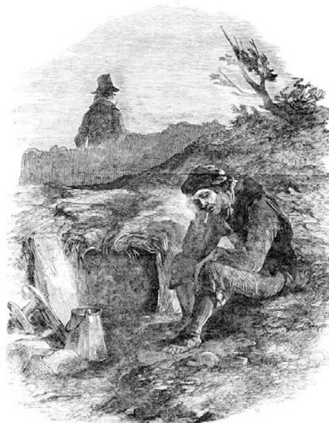
HEAD BY BRYAN CONNOR, NEAR ST. JOHN'S CATHEDRAL, DUBLIN.