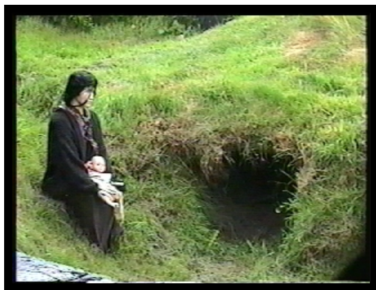
Reconstitution d'un scalp au Village de la famine Doagh dans le comté de Donegal, Irlande.

Avec l'exode des Irlandais (plus de 2 millions d'exilés en 10 ans) un bon nombre ont immigré au Canada, dont plusieurs au sud des seigneuries de Beaurivage et de Sainte-Croix. Avec eux sont arrivés leurs conflits, leur savoir-faire et aussi leur résilience