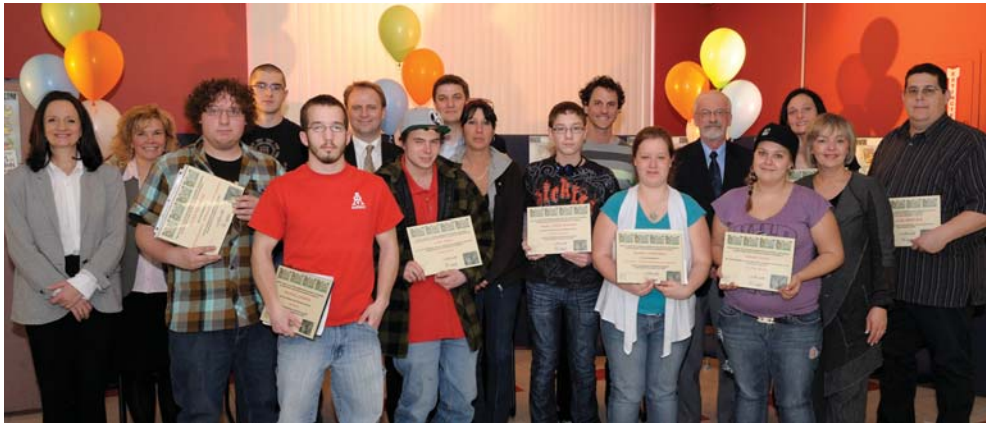
Les méritants du centre Saint-Louis accompagnés de représentants de la commission scolaire et de partenaires.