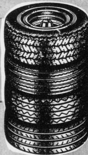
t.t.p. en sus