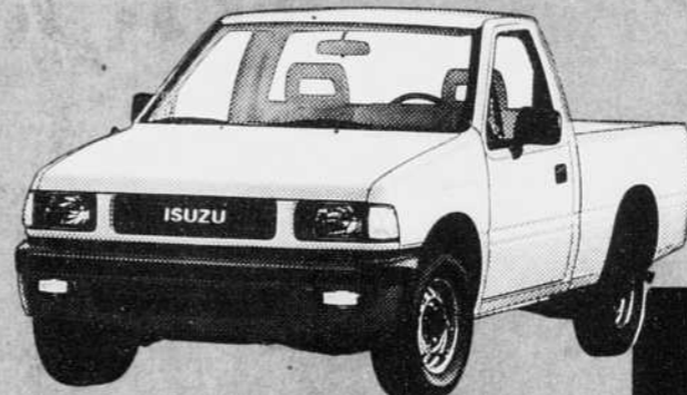
t.t.p. en sus