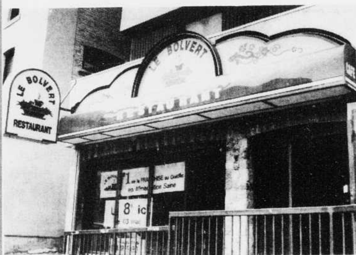
NOUVEAU CONCEPT DE RESTAURATION, AMBIANCE AMICALE, au 285, rue King ouest, Sherbrooke