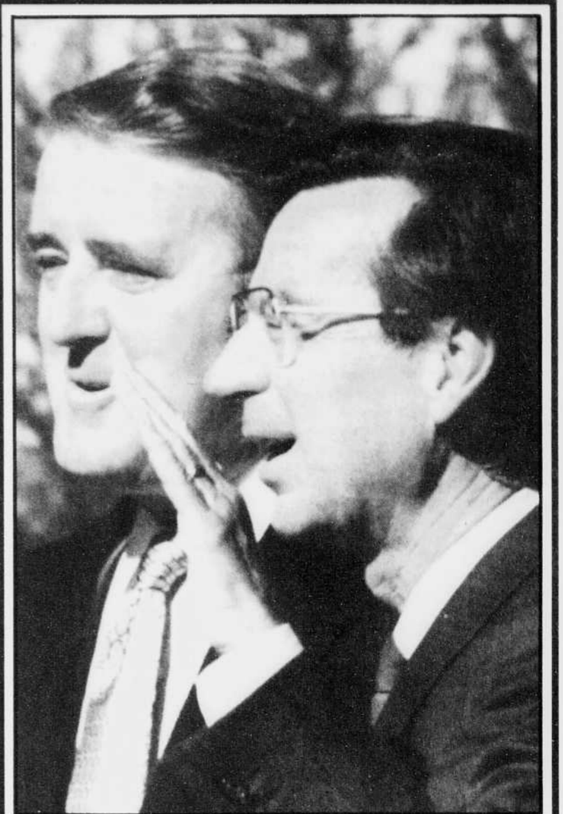
Les premiers ministres Mulroney et Bourassa affichaient le sourire, hier, avant leur rencontre à Ottawa.

C'est la onzième erreur de cible de l'IRA depuis l'attentat d'Enniskillen (Ulster) qui avait fait 11 morts dans la population civile en novembre 1987. La plupart de ces erreurs tragiques se sont produites en Irlande du Nord, mais en septembre dernier, la femme d'un soldat britannique a été tuée dans sa voiture piégée à Dortmund (RFA) et le mois suivant (octobre 1989), un bébé de six mois a été tué avec son père, un caporal de la Royal Air Force, à la sortie d'un restaurant de Wildenrath (RFA).