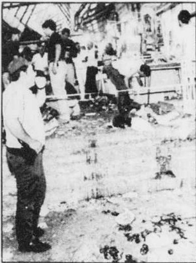
Après l'attentat dans le souk de Jérusalem, un policier surveille la scène. L'opération a été revendiquée par le Jihad islamique.

Une bombe tue un Israélien et fait neuf autres blessés